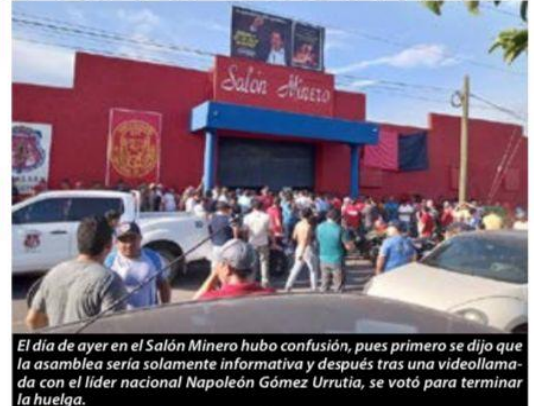
El día de ayer en el Salón Minero hubo confusión, pues primero se dijo que la asamblea sería solamente informativa y después tras una videollamada con el líder nacional Napoleón Gómez Urrutia, se votó para terminar la huelga.