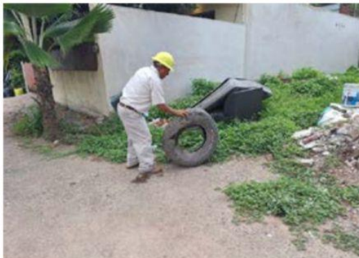
Objetos inservibles donde puede reproducirse el mosquito transmisor de la enfermedad, fueron retirados de los sitios donde se encontraban tirados.

Desde el 27 de junio se han visitado 46 mil 200 viviendas para ➤ 3