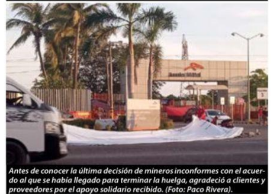
Antes de conocer la última decisión de mineros inconformes con el acuerdo al que se había llegado para terminar la huelga, agradeció a clientes y proveedores por el apoyo solidario recibido.