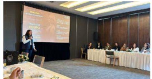
Personal de Asipona-LC sostuvo una reunión de trabajo en la Ciudad de México con la empresa ferroviaria Canadian Pacific Kansas City (CPKC).