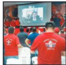
MINEROS ESCUCHARON A SU LÍDER NACIONAL, NAPOLEÓN GÓMEZ.

El secretario nacional del sindicato minero, Napoleón Gómez Urrutia, a través de un video expuso a los trabajadores la necesidad de terminar con el bloqueo para atender próximas negociaciones.