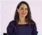
Claudia Curiel de Icaza Secretaría de Cultura

Los tres nuevos integrantes presentados son "jóvenes brillantes", destacó. / Pág.06