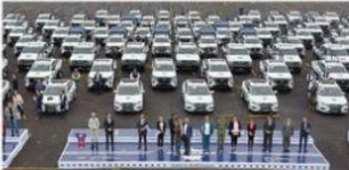
El gobernador Alfredo Ramírez Bedolla, hizo entrega ayer de patrullas y equipamiento a diversos municipios de la entidad, adquirido a través del programa Fortapaz.

El mandatario destacó que, para la adquisición de las patrullas y