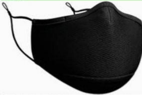
Cubrebocas deja de ser obligatorio su uso, ahora será responsabilidad individual seguir utilizándolo.

Ante la pregunta ¿Deben seguir usando el cubrebocas o no?, el epidemiólogo Oscar Cordero Reyes, respondió un sí y argumentó que de haber sido un mecanismo para evitar el contagio de Covid-19, pasa a ser elemento que seguirá acompañándonos como protector.