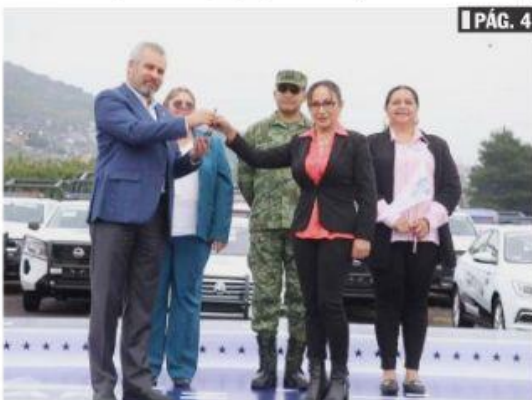
MORELIA, MICH.- La alcaldesa Itzé Camacho, recibió del gobernador Alfredo Ramírez Bedolla, patrullas y equipamiento para el municipio de Lázaro Cárdenas.