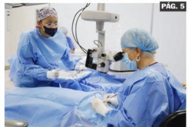
URUAPAN, MICH.- El gobierno del estado, anunció el reinicio de las cirugías de cataratas en los hospitales de la Secretaría de Salud de Michoacán.