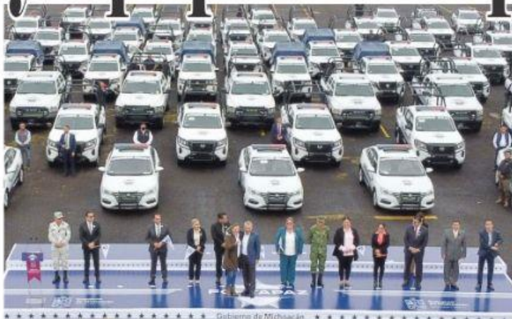
MORELIA, MICH.- A través del Fortapaz, el gobierno que encabeza Alfredo Ramírez Bedolla, entregó patrullas y equipos a 57 municipios de la entidad.