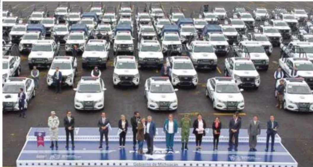
Seguridad. El gobernador de Michoacán hizo la entrega simbólica de 105 patrullas y equipo táctico a 57 alcaldes en una primera etapa.

Estrategia. Cabe señalar que las cifras oficiales indican que en cuanto a hechos de homicidio doloso la reducción es del 31% entre enero y agosto. Durante la entrega del primer paquete de patrullas del Fortapaz, el gobernador, Alfredo Ramírez, y el titular del SESESP, César Erwin Sánchez, señalaron que se sigue trabajando para mejorar la seguridad. Págs. 02 y 03