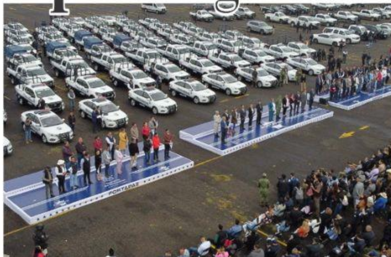
MORELIA, MICH.- El gobierno que encabeza Alfredo Ramírez Bedolla, hizo entrega de patrullas y equipamiento a 57 municipios de la entidad, a través del Fortapaz.