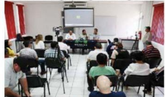
Ante una nutrida asistencia, ayer se expusieron a empresarios locales, los objetivos que se ha fijado la organización Merceces, entre ellos además de exigir la ampliación a 4 carriles de la vía del siglo 21, la mejora de sus servicios.

Durante la conferencia del anuncio de la 28 Semana Nacional de Compartiendo Esfuerzos de Alcohólicos Anónimos, el médico señaló que al estar al alcance de todos la posibilidad >>> 6