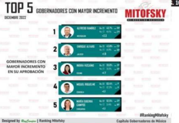
MORELIA, MICH.- La encuesta de Mitofsky publicada en El Economista, señala a Alfredo Ramírez Bedolla como el gobernador que tuvo mayor crecimiento en aprobación ciudadana durante 2022.

Alfredo Ramírez, el gobernador que más crece en las preferencias: El Economista