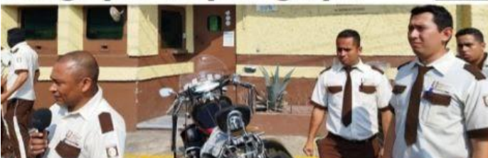
CD. LÁZARO CÁRDENAS, MICH.- Personal de Cometra Sucursal Lázaro Cárdenas, colocó las banderas rojinegras a raíz de despido injustificado a todo el personal que se desempeña en el traslado de valores.

Alfredo Ramírez, el gobernador que más crece en las preferencias: El Economista