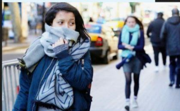
URUAPAN, MICH.- Autoridades de Protección Civil, alertaron a la población a seguir las recomendaciones ante los pronósticos de bajas temperaturas.