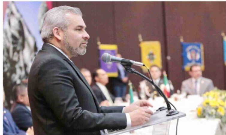
MORELIA, MICH.- El gobernador Alfredo Ramírez Bedolla, reconoció el compromiso de las Fuerzas Armadas con los gobiernos federal y estatal: "El apoyo brindado por cada uno de ustedes ha sido decisivo para recuperar la gobernabilidad de Michoacán", puntualizó durante la ceremonia con que se conmemoró el 90 Aniversario del Ejército Mexicano.