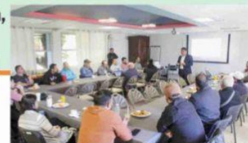
URUAPAN, MICH.- Confiados en que se podrá dejar de satanizar el programa de alcoholimetría, la SSPTyVM, y la SSM se reunieron con representantes de bares, restaurantes, cantinas y similares, para hablar sobre los beneficios de esas mediciones.