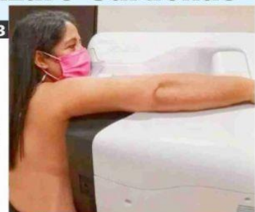
CD. LÁZARO CÁRDENAS, MICH.- La Jurisdicción Sanitaria No.8 está realizando gratuitamente estudios para detectar cáncer de mama, con una unidad móvil.