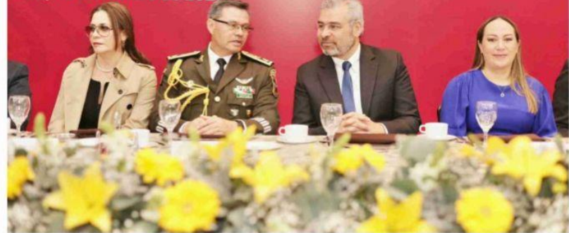
MORELIA, MICH.- El gobernador Alfredo Ramírez Bedolla, reconoció el compromiso de las Fuerzas Armadas con el gobierno federal y estatal, durante el evento para conmemorar el XC aniversario de la creación del Ejército Mexicano.