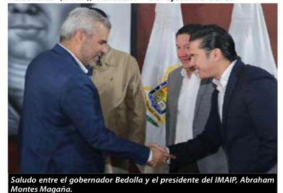
Saludo entre el gobernador Bedolla y el presidente del IMAIP, Abraham Montes Magaña.