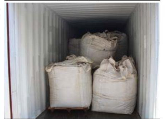
Parte del cargamento de marihuana asegurado por elementos de la Décima Zona Naval y de la Aduana Marítima, durante una inspección a contenedores dentro del Recinto Portuario de LC.