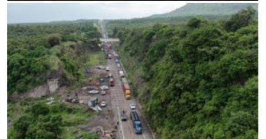
En opinión de comunicadores porteños, la falta de voluntad política para mejorar las condiciones de seguridad de la autopista Siglo 21, ésta seguirá siendo una de las más peligrosas del país para transitarla.