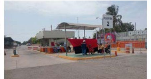
ArcelorMittal, puede dar por terminada la relación laboral con todos los obreros afiliados a la 271, al negar un Juez Federal el amparo solicitado por el Sindicato Minero.