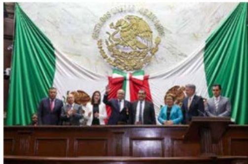
En sesión solemne, la 75 Legislatura de Michoacán, hizo entrega de la condecoración "Melchor Ocampo".