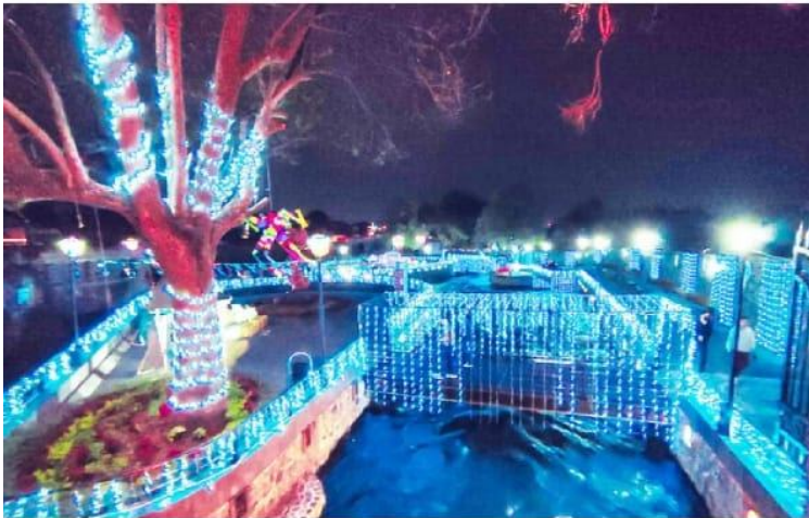
URUAPAN, MICH.- Sin lugar a dudas, en la presente temporada navideña el Parque Lineal Cupatitzio atraerá la atención de propios y extraños, convirtiéndose en el sitio que más visitas registre.