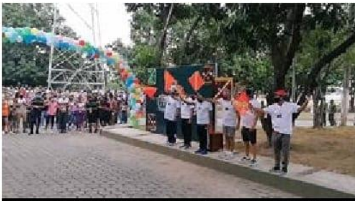
Momentos de dar el banderazo de arranque a la caminata dominical dentro de las instalaciones del 82 Batallón de Infantería de este lugar.