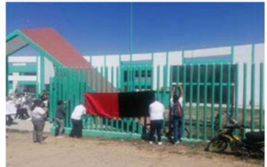
Ayer lunes, integrantes del sindicato de la Universidad Politécnica, fueron recibidos ya por un Subsecretario de Gobierno del estado, como un avance de encontrar pronto una solución al conflicto laboral.