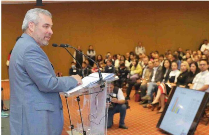
MORELIA, MICH.- Alfredo Ramírez Bedolla destacó que Michoacán cuenta con algo que no tienen otros estados: energías limpias suficientes, y agua en el Parque Bajío al tener un millón de metros cúbicos al año, además, el puerto de Lázaro Cárdenas es la conexión entre los mercados de Norteamérica y Asia.