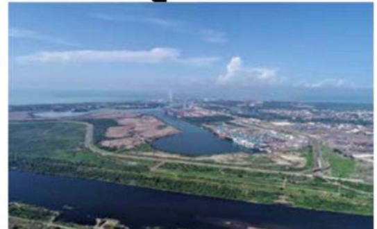
El gobernador Bedolla busca que la empresa Tesla se instale en Michoacán, y Puerto LC pudiera ser el elegido, dice.

Los casos activos de COVID-19 en el municipio de LC siguen a la baja. Ayer la SSM los ubicó en 20 en los últimos 14 días.