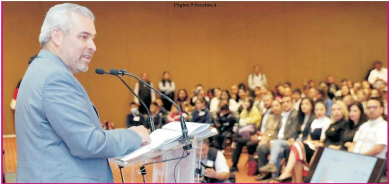
Página 5 Sección A

Este lunes inicia registro para asignación de plazas: SEE