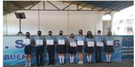
Alumnos de la secundaria técnica 106 de Buenos Aires, recibieron reconocimiento por su valiosa participación en evento académico organizado por el Cecytem.