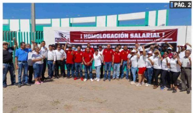
CD. LÁZARO CÁRDENAS, MICH.- Ocho organizaciones sindicales se manifestaron en apoyo al Sindicato Único de Trabajadores de la Universidad Politécnica de Lázaro Cárdenas, que mantiene una huelga para exigir la firma del contrato colectivo.