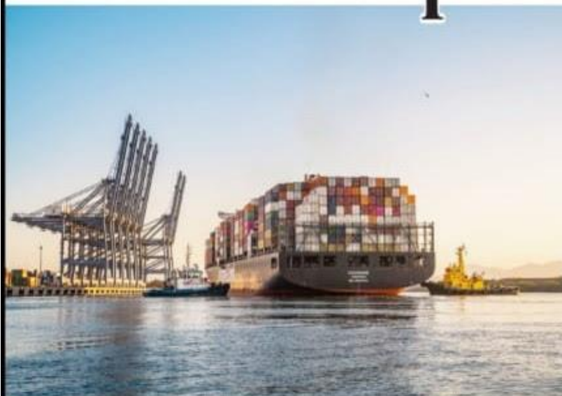
CD. LÁZARO CÁRDENAS, MICH.- De acuerdo a cifras de la naviera Maersk, los puertos de Lázaro Cárdenas y Manzanillo se han convertido en los más dinámicos, con menos de un día de espera para los barcos.

■ Destaca la naviera Maersk que en ambos se tiene menos de un día de espera PÁG. 3