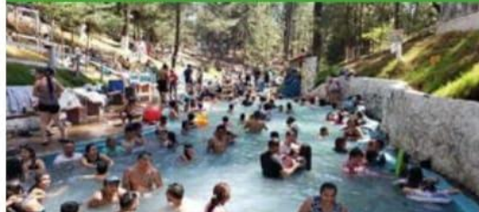
Alrededor de diez mil turistas abarrotaron los balnearios de aguas termales de Michoacán en esta temporada de Semana Santa.

* Balnearios del Gobierno de Michoacán reciben 10 mil turistas en Semana Santa: Foturmich.