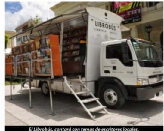
El Librobús, contará con temas de escritores locales.