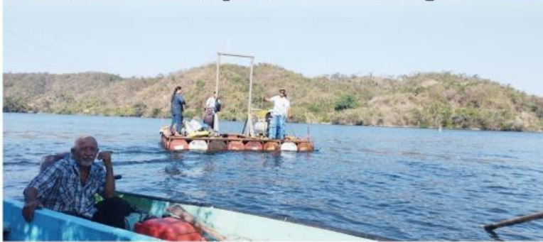
CD. LÁZARO CÁRDENAS, MICH.-Pescadores afectados en la presa La Villita, se manifestaron este fin de semana, impidiendo que buzos de CFE realizaran trabajos de mantenimiento a las máquinas de las compuertas de la presa.

■ Piden atender demandas por daño a su fuente de ingresos PÁG. 3