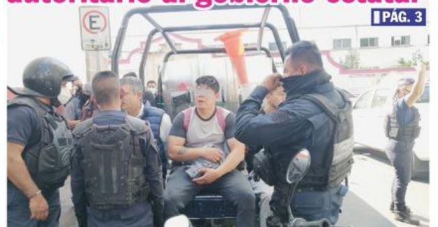
CD. LÁZARO CÁRDENAS, MICH.- Integrantes de la Coordinadora Nacional de Trabajadores de la Educación, mediante un comunicado, repudiaron el actuar del gobierno del estado por la represión de que fueron objeto sus compañeros en Morelia, el día de ayer.