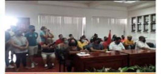
MARCHA: MIÉRCOLES 23 DE FEBRERO A LAS 10 DE LA MAÑANA. ESQUINA PLAZA ZIRAHUEN A LA PRESIDENCIA MUNICIPAL. Esta es la invitación a la marcha mitín de mañana miércoles, para exigir solución de la alcaldesa a diferentes demandas ciudadanas.

ARTICULO 39 CONSTITUCIONAL: EL PODER DIMANA DEL PUEBLO