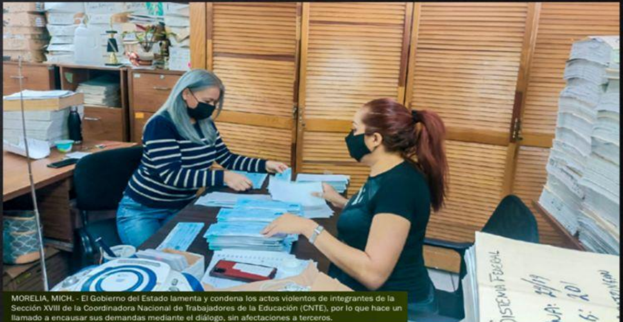
MORELIA, MICH. - El Gobierno del Estado lamenta y condena los actos violentos de integrantes de la Sección XVIII de la Coordinadora Nacional de Trabajadores de la Educación (CNTE), por lo que hace un llamado a encausar sus demandas mediante el diálogo, sin afectaciones a terceros.

Conforman comité de prevención, control y combate de incendios forestales