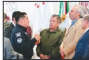
El gobernador Alfredo Ramírez, en reunión con funcionarios de seguridad, ambientales y de la FGE.