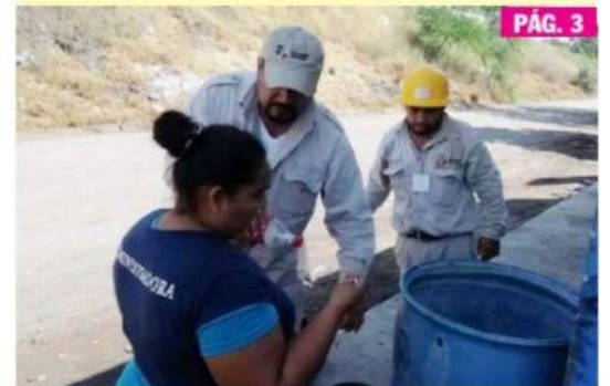
CD. LÁZARO CÁRDENAS, MICH.- Luego de que entrara a Michoacán el serotipo 03 de dengue, que incrementa la morbimortalidad, y dado que el presente año es ciclo de repunte del padecimiento, se planea un mega operativo.