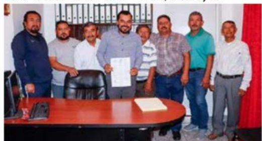
Autoridades indígenas firmaron la convocatoria para crear la bandera que representará a la Nación Nahua de la Costa de Aquila.

Estimadísimos lectores, vamos por una semana más, ya casi se va febrero el mes más corto, y el día de hoy les quiero platicar de que ayer 21 de febrero arran-