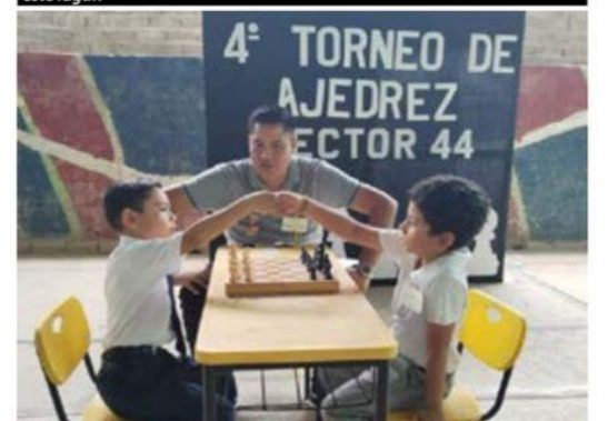
Con éxito realizan el 4º Torneo de Ajedrez del Sector 44.