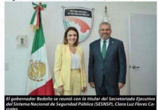
El gobernador Bedolla se reunió con la titular del Secretariado Ejecutivo del Sistema Nacional de Seguridad Pública (SESNSP), Clara Luz Flores Carreras.

Ciudad de México, 21 de agosto del 2022.- Con el propósito de fortalecer esquemas de seguridad en Michoacán, el gobernador Alfredo Ramírez Bedolla se reunió con el titular del Secretariado Ejecutivo del Sistema Nacional de Seguridad Pública (SESNSP), Clara Luz Flores Carreras.