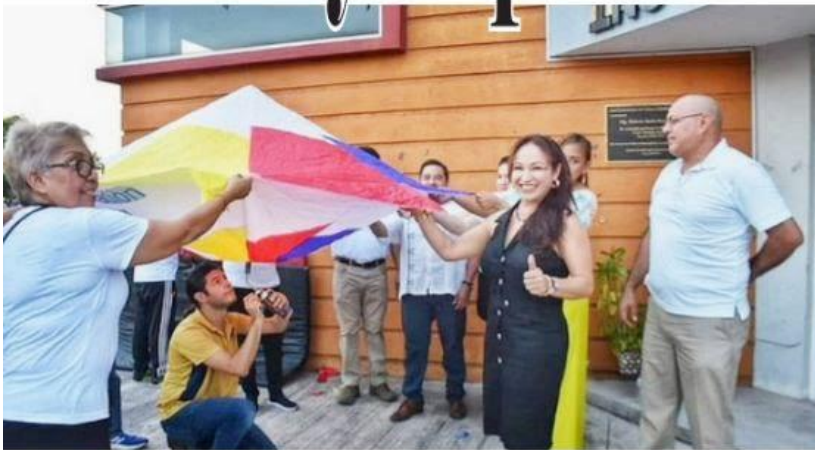
CD. LÁZARO CÁRDENAS, MICH.- El Centro Cultural "Juan Gamiz Díaz" nuevamente abrió sus puertas, tras el cierre obligado por la pandemia.

Tras el paro obligado a causa de la pandemia PÁG. 2