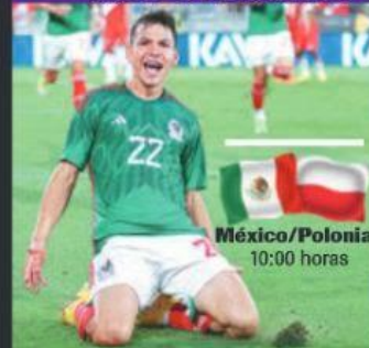
México/Polonia 10:00 horas