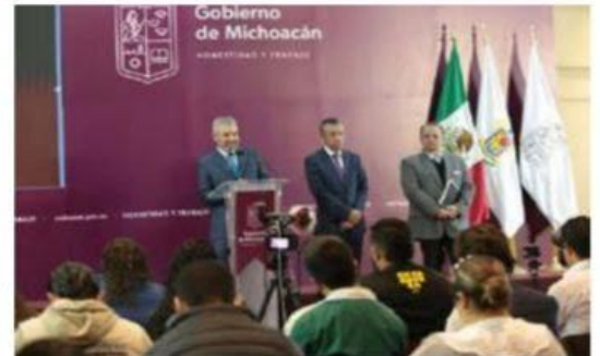
El gobernador Alfredo Ramírez Bedolla, dio a conocer ayer que en el presupuesto 2023 del gobierno estatal, no se contempla nueva deuda ni nuevos impuestos.

Morelia, Michoacán, 21 de noviembre del 2022.- El Presupuesto 2023 del Gobierno de Michoacán es equilibrado y justo, sin nuevos derechos e impuestos, transparente y orientado a atender los temas prioritarios