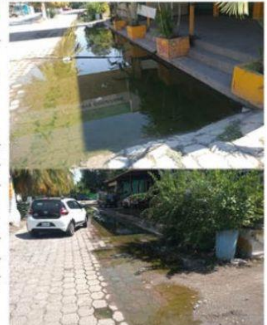
En estas dos gráficas se puede observar las pestilentes aguas negras que corren por las calles de la colonia Ampliación Comunal Morelos y que representan un serio peligro para la salud de sus habitantes.