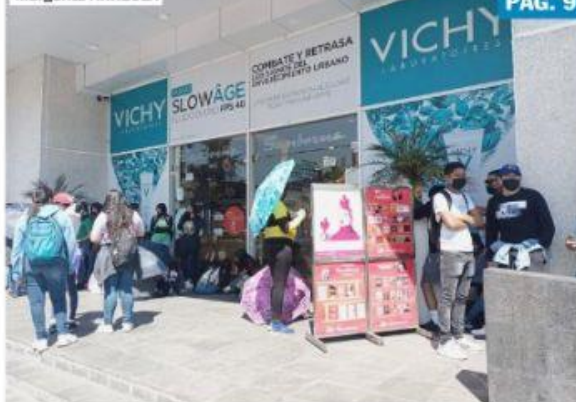
MORELIA, MICH.- Lejos de levantar el plantón que instalaron en el Centro Histórico, la CNTE bloqueó ayer la emblemática Plaza Las Américas, así como algunas carreteras.