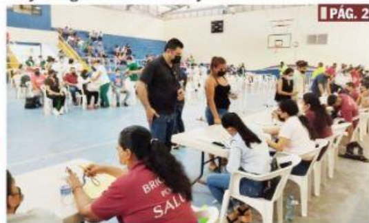
CD. LÁZARO CÁRDENAS, MICH.- Un total de 10,356 dosis de AstraZeneca y Cansino fueron aplicadas en jueves, viernes y lunes, durante la jornada de vacunación a personas de 30 a 39 años y rezagados de 18 años y más.