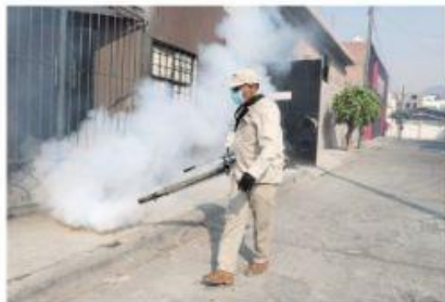
MORELIA, MICH.- Los casos de dengue han disminuido en el estado, gracias a los trabajos de saneamiento básico que realiza personal de la Secretaría de Salud.

Michoacán, a la baja en casos de dengue en comparación con 2021