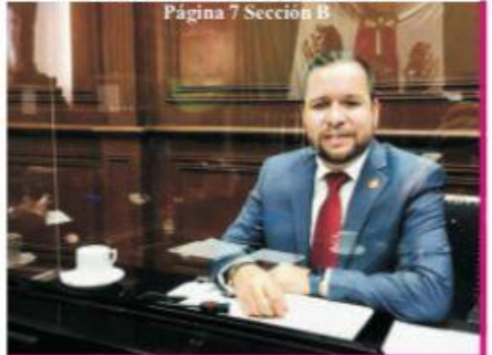
Página 7 Sección B

ONMPRI llevo a cabo la conferencia virtual «Rompiendo los mitos de amor romántico» Página 2 Sección A