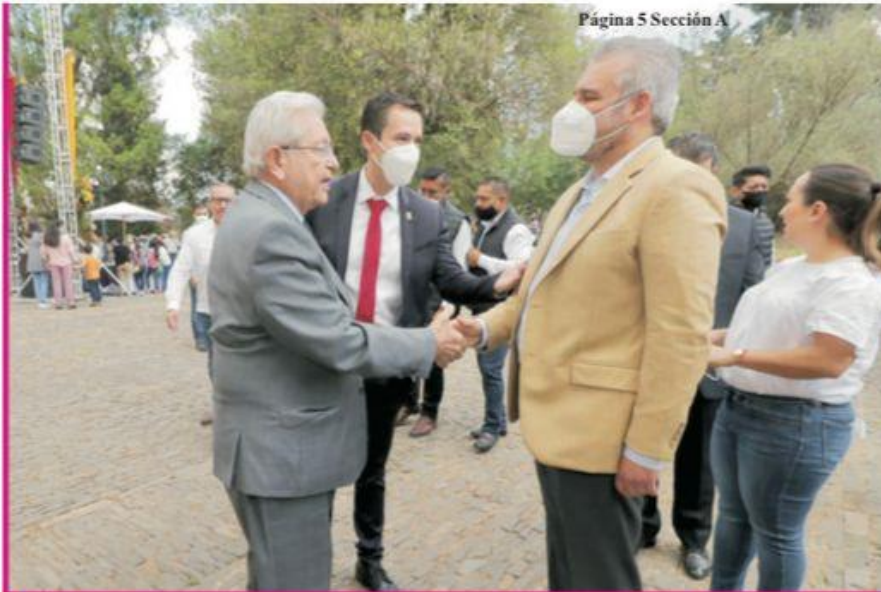
Página 5 Sección A

Gobierno Municipal de Hidalgo, Conafor, Cofom y Semarnat, Asociaciones Civiles, dueños poseedores de bosques y voluntarios, inician trabajos de Brigadas de Protección en Incendios Forestales