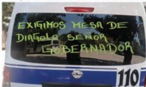
Este miércoles habrá paro generalizado del transporte urbano y suburbano de este municipio. Concesionarios exigen diálogo con el gobierno.

Un paro de actividades acordaron los concesionarios del servicio público en la modalidad de combis, para llevarlo a cabo ➡ 2