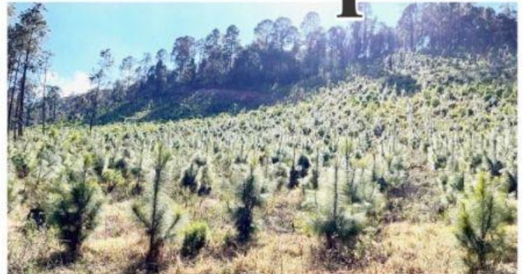
URUAPAN, MICH.- Luego de diez años de trabajo constante, Apeam empieza a ver resultados de su Programa Forestal, con el cual han recuperado más de 20 mil hectáreas de bosques en Michoacán.