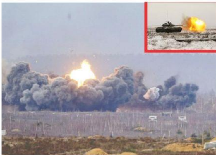
KIEV, UCRANIA.- Desoyendo exhortos internacionales, Rusia invadió anoche Ucrania, y bombardeó algunas de sus ciudades más importantes.