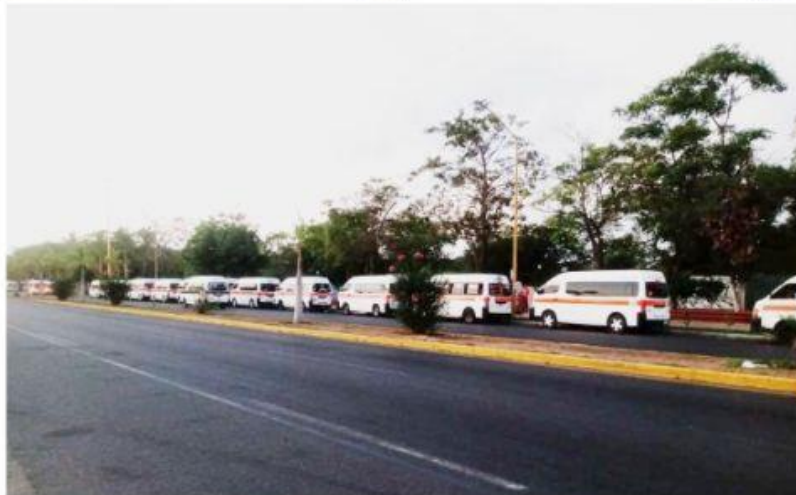
CD. LÁZARO CÁRDENAS, MICH.- El día de ayer, transportistas de servicio público paralizaron al municipio de Lázaro Cárdenas, con el fin de que el gobierno de Michoacán, deje de hostigarlos y les permitan el aumento de $2 en la tarifa. Con ello, perjudicaron a miles de usuarios, entre ellos obreros y estudiantes.

Atiende SSM de manera oportuna a familia de LC, agredida por murciélagos PÁG. 4