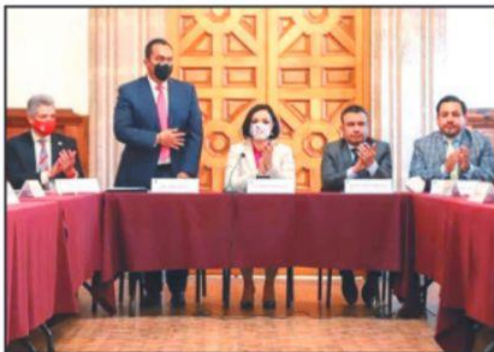
ADRIÁN LÓPEZ SOLÍS, FISCAL GENERAL DEL ESTADO, PRESENTÓ ANTE EL CONGRESO DE MICHOACÁN SU INFORME ANUAL DE TRABAJO; PIDIÓ A LEGISLADORES APOYO PRESUPUESTAL PARA MEJORAR RESULTADOS.

HOY EN... Jueves CULTURA • ARTE • PATRIMONIO