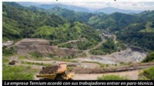
La empresa Ternium acordó con sus trabajadores entrar en paro técnico.

paro técnico de este centro de trabajo, con el que aproximadamente 7