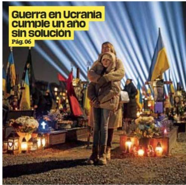
Decesos. Más de 300 mil personas han fallecido tras el conflicto bélico; entre ellas se encuentran —además de soldados— civiles e, incluso, niños.