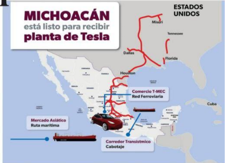
MORELIA, MICH.- A través de diversos medios, el gobierno de Michoacán, ha intensificado su campaña para atraer a estas tierras la instalación de la planta de Tesla y el Puerto de Lázaro Cárdenas, se perfiló como el mejor destino.