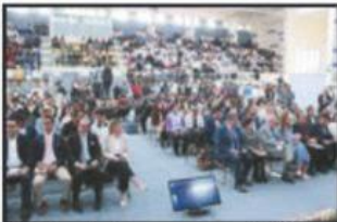
UVAQ, sede de la presentación del informe.