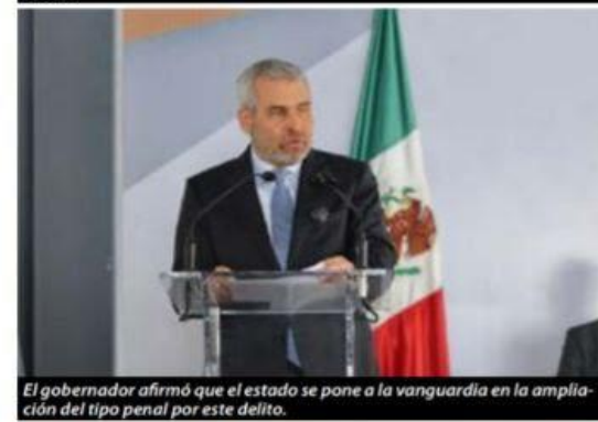
El gobernador afirmó que el estado se pone a la vanguardia en la ampliación del tipo penal por este delito.