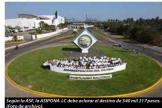
Según la ASF, la ASIPONA-LC debe aclarar el destino de 540 mil 217 pesos.