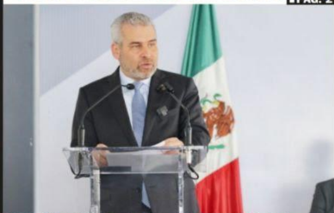
MORELIA, MICH.- Michoacán está a la vanguardia en la ampliación del tipo penal por extorsión, considera el gobernador, Alfredo Ramírez Bedolla.

■ Liberan crías de laúd en campamento de Playa Azul PÁG. 3