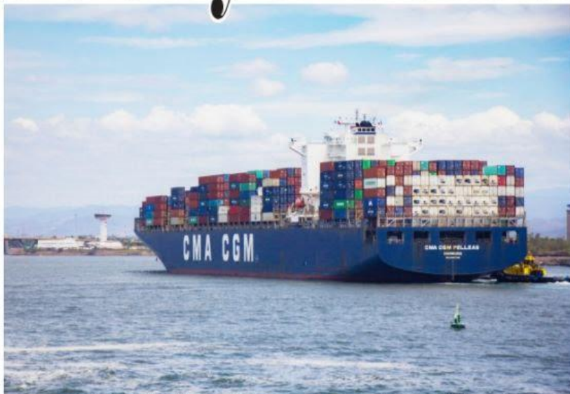
CD. LÁZARO CÁRDENAS, MICH.- Puerto Lázaro Cárdenas, tiene profundidad, conectividad y una ubicación privilegiada que le permite trazar rutas marítimas al este, oeste, norte y sur de Estados Unidos, Asia e interior del país donde su área de influencia abarca 27 estados.

■ Celebra Bedolla aprobación de reforma penal PÁG. 2