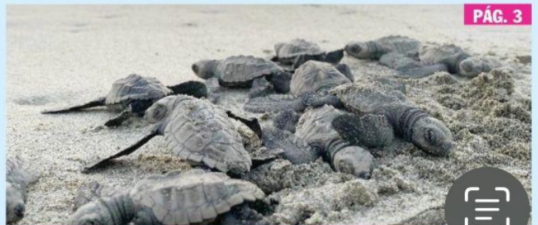
MORELIA, MICH.- La temporada de conservación de la tortuga marina en la Costa Michoacana concluyó con la liberación de 2.4 millones de crías, informó la Comisión de Pesca.

Docente, los trámites de la SEE con mayor demanda los puedes hacer en línea