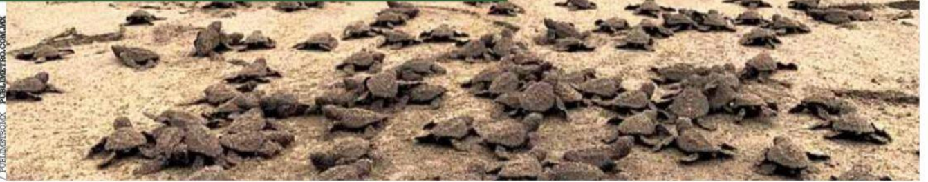
Biodiversidad. Tres de las siete especies de tortugas marinas que hay en el planeta tienen presencia en el estado: golfina, negra y laúd.

Inflación vuelve a acelerar y llega a 4.78% anual Pág. 08