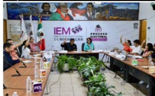
En sesión extraordinaria, el IEM aprobó ayer medidas de verificación para la autenticidad de la documentación electoral.