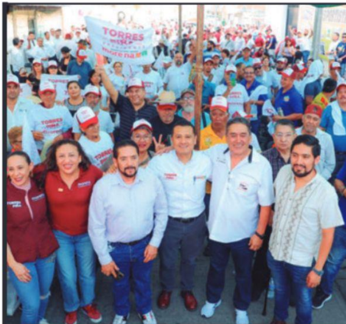
TRANSPORTISTAS SE REUNIERON CON EL CANDIDATO A LA PRESIDENCIA MUNICIPAL DE MORELIA.