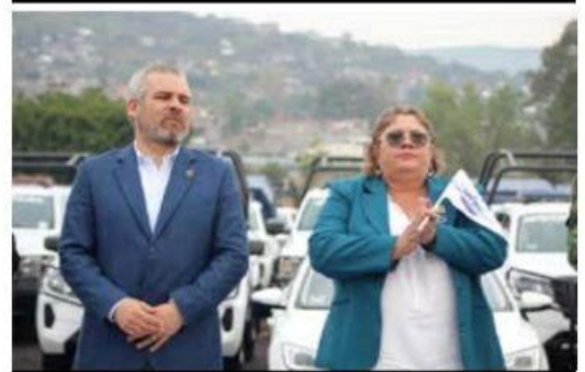
La diputada Julieta García Zepeda, ha sido una fuerza impulsora detrás del Fondo de Fortalecimiento para la Paz (Fortapaz).