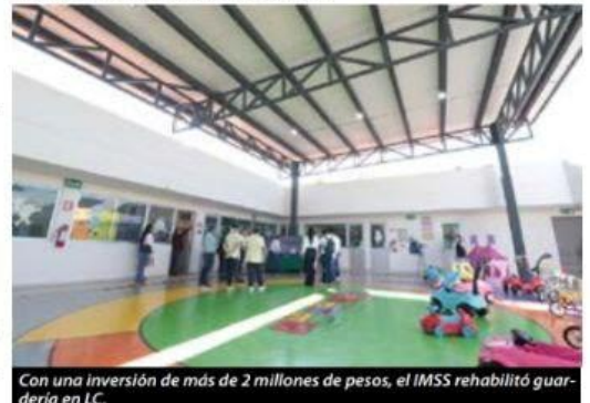
Con una inversión de más de 2 millones de pesos, el IMSS rehabilitó guardería en LC.