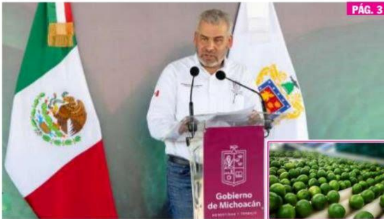
APATZINGÁN, MICH.- La próxima semana iniciarán los procesos de inspección fitosanitaria y trazabilidad o movilidad de origen para la certificación y regulación del limón en Michoacán

► Gobernador tomó protesta a integrantes de la Junta Local de Sanidad Vegetal en Apatzingán