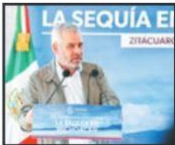
EL GOBERNADOR ALFREDO RAMÍREZ BEDOLLA PRESIDIO EN ZITÁCUARO FORO CONTRA SEQUÍA.

Más del 45 por ciento de las 6 millones de hectáreas del estado sufren sequía extrema; el 22%, severa; el 6.3%, moderada, y el 24 por ciento se encuentran normalmente secas; ante tal crisis, el gobernador de Michoacán, Alfredo Ramírez Bedolla, anunció la construcción de una planta tratadora de aguas, en Zamora; la rehabilitación de otra en Uruapan y la inversión de 500 millones de pesos en diversas obras hídricas en los municipios, con lo que pretende "amortiguar" la crisis.