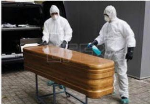
Mañana 26 de marzo se cumplen ya dos años del primer deceso por COVID-19 en todo Michoacán, y que ocurrió en este puerto, en la persona de un taxista. (Foto ilustrativa).

El jueves 26 de marzo de 2020, Michoacán registró el primer deceso en Covid, cuyo virus había llegado al estado por un viajero de España a este Puerto con relación laboral en ArcelorMittal. De entonces a la fecha, ➤ 6