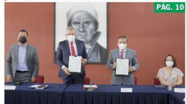
MORELIA, MICH.- El gobierno del estado y el Instituto Nacional Electoral (INE), firmaron convenio de colaboración para facilitar la realización de la consulta ciudadana en materia de revocación de mandato el próximo 10 de abril.