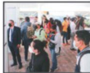
Con éxito se realizó en Deconeso la Feria del Empleo, con la participación de 149 empresas.