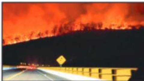
Ciudadanos captaron la intensidad del incendio en la Loma de Santa María.