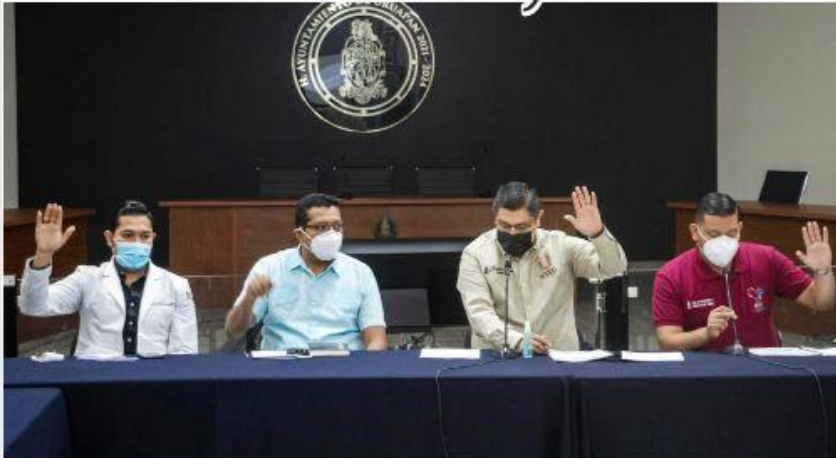
URUAPAN, MICH.- El Comité Municipal de Salud, encabezado por el alcalde Ignacio Campos Equihua, aprobó asumir el decreto estatal sobre actividades preventivas de sanidad para evitar la propagación de la pandemia del Covid-19.

■ Sector salud exhorta a continuar con las medidas de prevención y contención