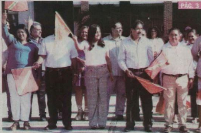
CD. LÁZARO CÁRDENAS, MICH.- Autoridades municipales dieron el banderazo de arranque al Operativo de Semana Santa 2024, el cual será coordinado por dependencias de los tres niveles de gobierno.

▶ Coordinarán acciones dependencias de los tres niveles de gobierno PÁG. 3