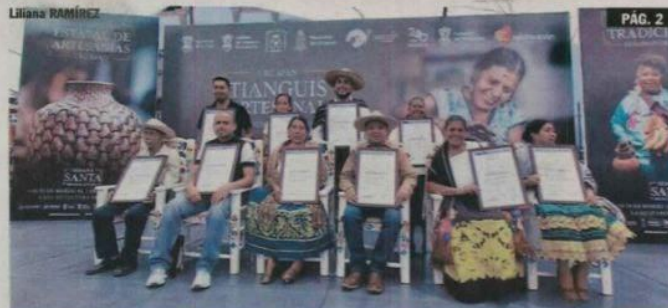
URUAPAN, MICH.- "La Huatápera", sirvió como escenario para realizar la entrega de premios a los ganadores del LXIII Concurso Estatal de Artesanías.

► Dentro del marco del Tianguis Artesanal de Domingo de Ramos