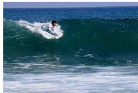
Dieciocho jóvenes buscarán superar los resultados anteriores en Manzanillo, Colima.