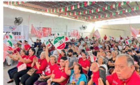
El pasado sábado en las instalaciones del PRI municipal, se recordó el 30 aniversario del magnicidio en contra del entonces candidato del tricolor partido a la Presidencia de la República, Luis Donaldo Colosio Murrieta.