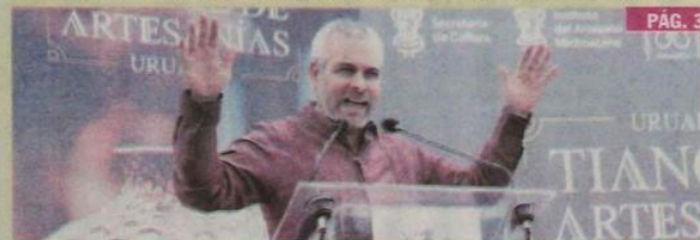
URUAPAN, MICH.- El gobernador Alfredo Ramirez Bedolla hizo entrega de los premios a los ganadores del LXIII Concurso Estatal de Artesanías que organizó el Instituto del Artesano Michoacano, en el marco del Tianguis Artesanal de Domingo de Ramos.

▶ Dentro del marco del Tianguis Artesanal de Domingo de Ramos PÁG. 3