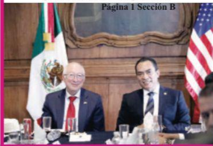
Página 1 Sección B