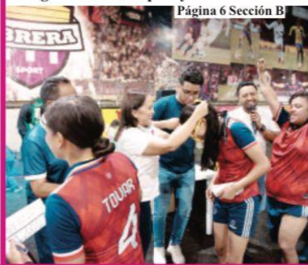
Página 6 Sección B