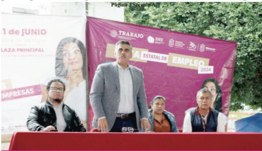
Página 3 Sección A