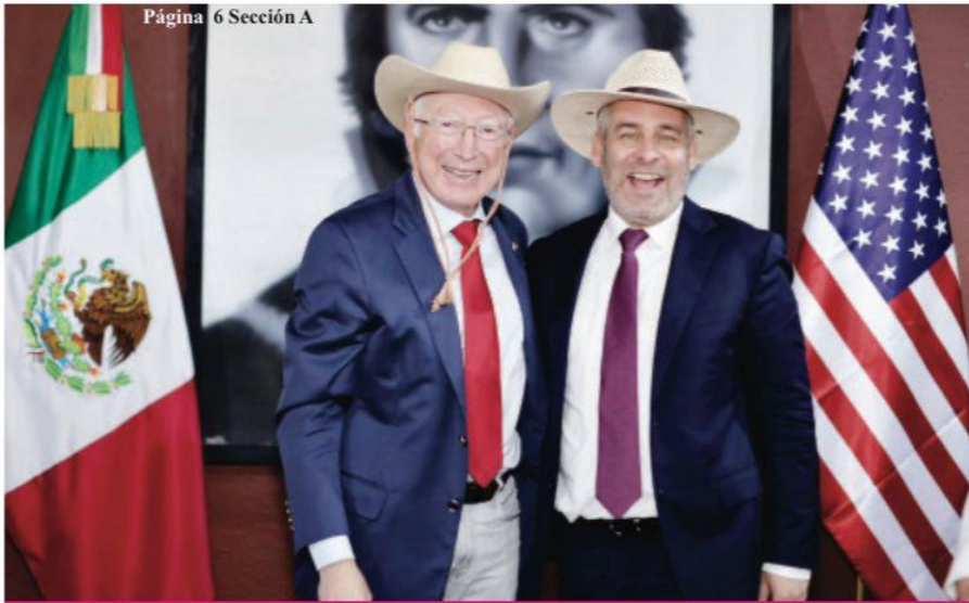
Página 6 Sección A