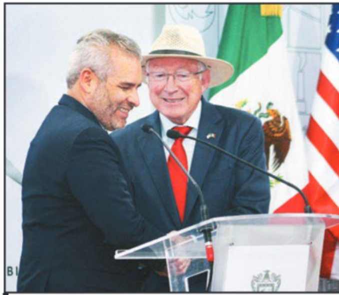
EL GOBERNADOR ALFREDO RAMÍREZ BEDOLLA RECIBIÓ EN CASA MICHOACÁN A KEN SALAZAR, EMBAJADOR DE LOS ESTADOS UNIDOS EN MÉXICO; TRATARON TEMAS RELATIVOS A LA REACTIVACIÓN DE EXPORTACIONES.