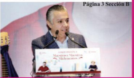
Página 3 Sección B