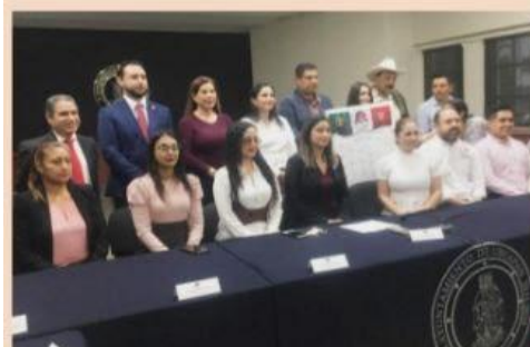
URUAPAN, MICH.- Ayer se instaló la Junta Cívica Patriótica Municipal, la cual contará con un presupuesto de 1.844 millones de pesos para las actividades con que se festejará el Mes Patrio en este municipio.