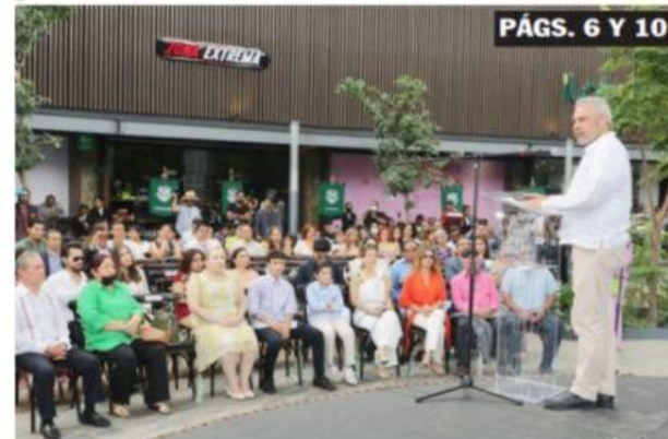
APATZINGÁN, MICH.- Al inaugurar este miércoles la Plaza Paseo Akia y salas Cinépolis de Apatzingán, el gobernador, Alfredo Ramírez Bedolla, afirmó que la entidad ha logrado recuperar la confianza de las empresas michoacanas para invertir y generar empleos directos e indirectos en distintos sectores productivos del estado.