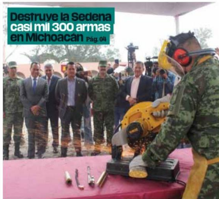
Por la paz. Autoridades federales y estatales supervisaron la destrucción de las armas, entre las cuales había 698 cortas y 576 largas.

Destruye la Sedena casi mil 300 armas en Michoacán Pág. 04