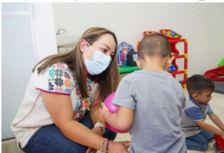
ORELIA, MICH.- El DIF Michoacán abrió dos estancias para hijas e hijos de jornaleros en Apatzingán y Buenavista.

Puerto de LC, la joya de la corona para potenciar la actividad minera, afirma Bedolla PÁG. 2