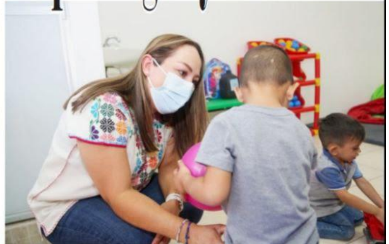
MORELIA, MICH.- El DIF Michoacán abre dos estancias para hijas e hijos de jornaleros en Apatzingán y Buenavista.

CUADRUPLA DE MEXICO.- Miles de trabajadores agrícolas, entre cortadores de aguacate principalmente, serán beneficiados con derechos laborales, dijo el gobernador Alfredo Ramírez Bedolla en reunión con Luisa María Alcalde Luján, secretaria del Trabajo y Previsión Social.