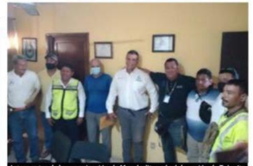
Integrantes de la organización de Mandaditos y la delegación de Tránsito de este lugar, unen esfuerzos por una mejor cultura vial.