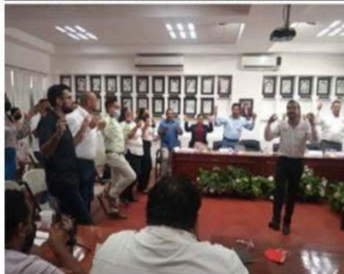
Ayer se puso en marcha el programa "México sí lee".

movilidad. Durante el encuentro, los operarios