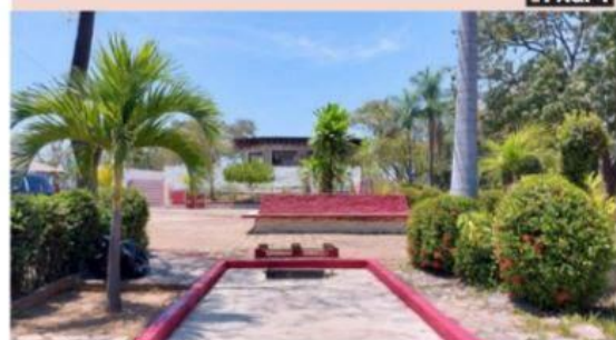
CD. LÁZARO CÁRDENAS, MICH.- Con la finalidad de que se encuentren en óptimas condiciones para un sano esparcimiento, el Ayuntamiento se encuentra trabajando en el mantenimiento a los espacios públicos, en este caso, el parque "Eranden".

Gobierno Municipal procura limpieza y mantenimiento en áreas verdes, parques y jardines PÁG. 4