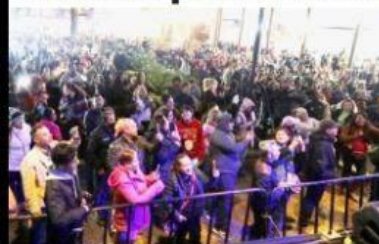
URUAPAN, MICH.- Miles de personas acudieron a disfrutar la presentación de Garibaldi, en el marco de las actividades del Festival Navideño Uruapan 2022.