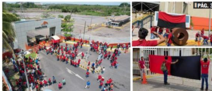
CD. LAZARO CÁRDENAS, MICH.- En este 2022 el sindicato minero estalló varias huelgas en la ciudad y puerto, en las empresas donde tienen presencia sus agremiados, como fue en ArcelorMittal, en el laminador, y en la empresa Fertinal.