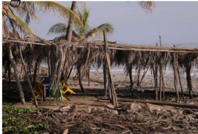
MORELIA, MICH.- Sedeco entregó diversos apoyos por 3.5 millones de pesos, en beneficio de 199 micro y pequeñas empresas de diversos municipios, entre éstos los afectados por el sismo registrado en septiembre de este año.

Anuario 2022: la riqueza de la siderúrgica, el tren continuo del gobierno del estado y la federación se muestra con el puerto