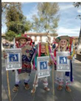
CD. LAZARO CÁRDENAS, MICH.- La campaña de Comercios Ecológicamente Responsables de Deportistas con Causa, se está llevando a otras ciudades de Michoacán.

Canaco replica fuera de LC iniciativa de Deportistas con Causa