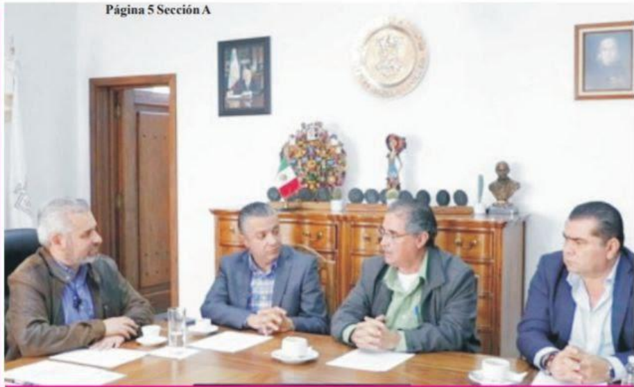
Página 5 Sección A

70 artesanos locales esperan buenas ventas durante esta temporada de fin de año en Zitácuaro