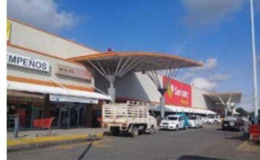
De acuerdo a lo manifestado por trabajadores de la Tienda Soriana de este puerto, este lunes no abrirá sus puertas por el paro de labores de poco más de cien empleados que demandan un mejor reparto de utilidades 2023.