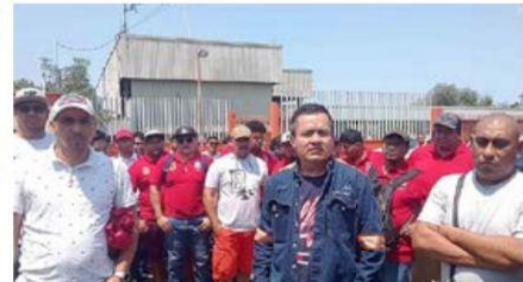
En entrevista el pasado sábado, obreros de ArcelorMittal, afiliados a la Sección 271 y otras que pertenecen al mismo gremio, se declararon en huelga de hechos, para exigir a la acerera un mejor reparto de utilidades 2023.

poco más de 100 empleados estallarán un paro laboral en demanda » 7