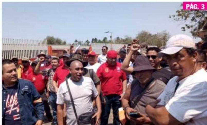
CD. LÁZARO CÁRDENAS, MICH.- Obreros de la empresa ArcelorMittal mantienen una manifestación en la puerta de entrada a la fábrica de aceros, en rechazo a la propuesta de pago de utilidades. PÁG. 3

► Mantienen manifestación y amagan con ir a huelga de hechos