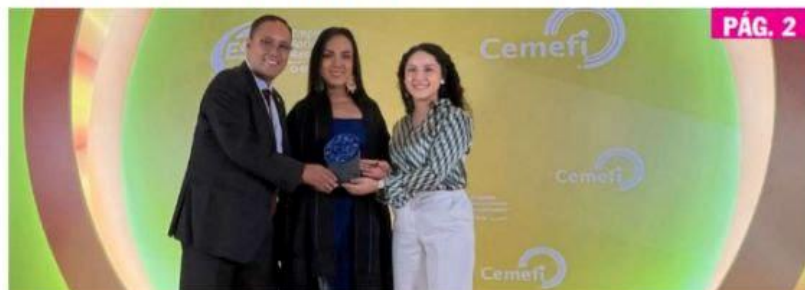
CD. LÁZARO CÁRDENAS, MICH.- En el XVII Encuentro Latinoamericano de Empresas Socialmente Responsables "El Impacto del Distintivo ESR® en los modelos de negocio", el Cemefi distinguió por treceavo año consecutivo a la siderúrgica ArcelorMittal México. PÁG. 2