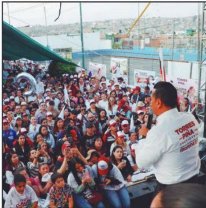
EN LA COLONIA JESÚS ROMERO FLORES SE LLEVÓ A CABO EL SEGUNDO CIERRE DE CAMPAÑA.