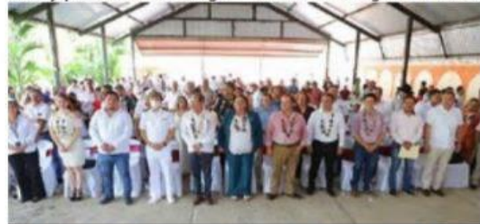
La diputada local y presidenta del Congreso del Estado, visitó las tenencias del municipio para informarle al pueblo del trabajo realizado en el primer año legislativo