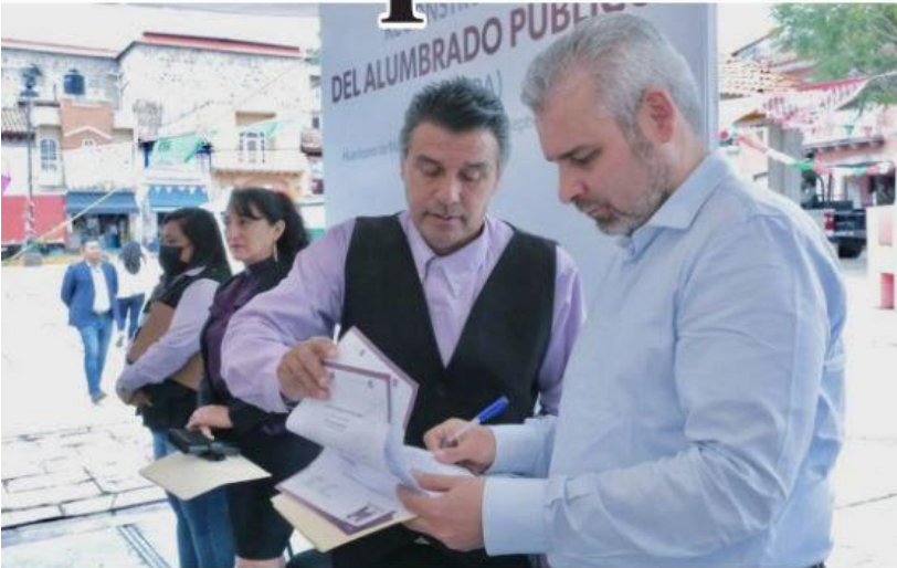
MORELIA, MICH.- El sentido municipalista del gobierno de Alfredo Ramírez Bedolla, ha permitido la recuperación de la confianza ciudadana, dado el impulso a obras de infraestructura urbana en diferentes municipios, coinciden alcaldes.

■ Apoyos en salud, educación, seguridad y obra pública, dan cuenta del respaldo del gobernador a las distintas demarcaciones, señalan alcaldes PÁG. 3