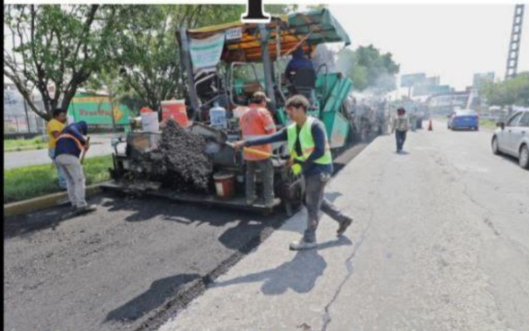
MORELIA, MICH.- El sentido municipalista del gobierno de Alfredo Ramírez Bedolla, ha permitido la recuperación de la confianza, dado el impulso a obras de infraestructura urbana en los municipios, coinciden alcaldes.

■ Apoyos en salud, educación, seguridad y obra pública, dan cuenta del respaldo del gobernador a las distintas demarcaciones, señalan PÁG. 3