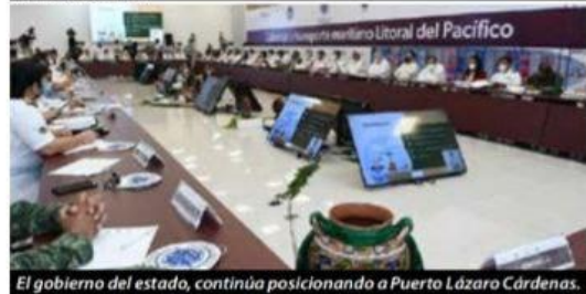
El gobierno del estado, continúa posicionando a Puerto Lázaro Cárdenas.

Para impulsar a ese polo de desarrollo, entre otras acciones, el 12 de noviembre del 2021 se ➤ 2