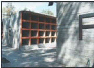
ARCHIVO. LA VOZ DE MICHOACÁN

En 2 años fue construido el Panteón Forense.