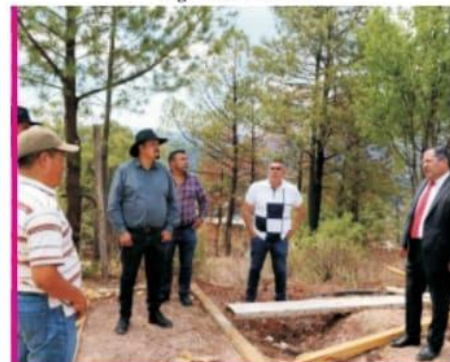
Página 2 Sección A

EL CLARIN Diario de la Región Oriente de Michoacán