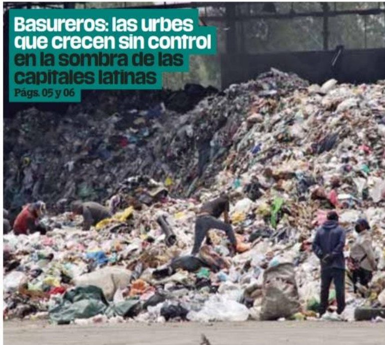
Consumo. Al año en el mundo se producen 2 mil millones de toneladas de basura doméstica.