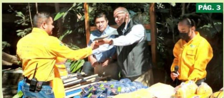
URUAPAN, MICH.- Brigadistas del Parque Nacional recibieron equipo de protección y herramienta, que fueron donados por la Asociación de Productores y Empacadores Exportadores de Aguacate de México PÁG. 3