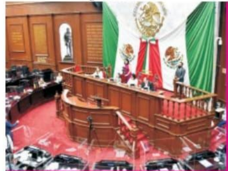
Página 6 Sección B