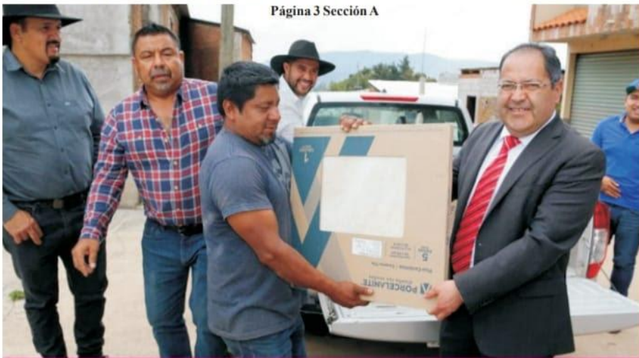
Página 3 Sección A