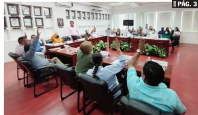
CD. LÁZARO CÁRDENAS, MICH.- El Órgano de Gobierno aprobó el Primer Informe Trimestral de las Finanzas Públicas Trimestrales.

■ Acuerdan convenio para regularizar autos chocolate PÁG. 3