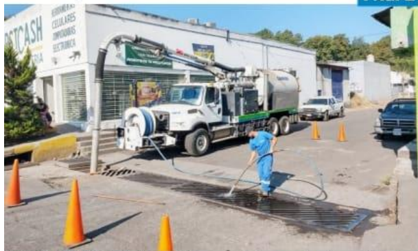
JRUAPAN, MICH.- Trabajadores de Capasu continúan con el programa de limpieza de canales y barrancas; hasta ahora han retirado 22 mil 350 toneladas de residuos.