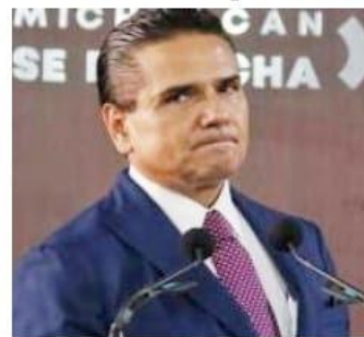
MORELIA, MICH.- El exgobernador de Michoacán, Silvano Aureoles Conejo, enfrenta denuncias por desfalco y red de desvíos en el erario público.