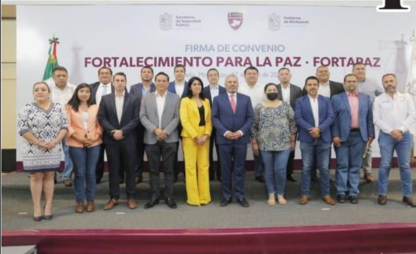
MORELIA, MICH.- 19 municipios más ratificaron su confianza en el gobierno estatal y se sumaron a la firma de convenio del Fondo para el Fortalecimiento de la Paz.

■ Tendremos éxito si nos mantenemos unidos para dar resultados a la ciudadanía: gobernador PÁG. 10