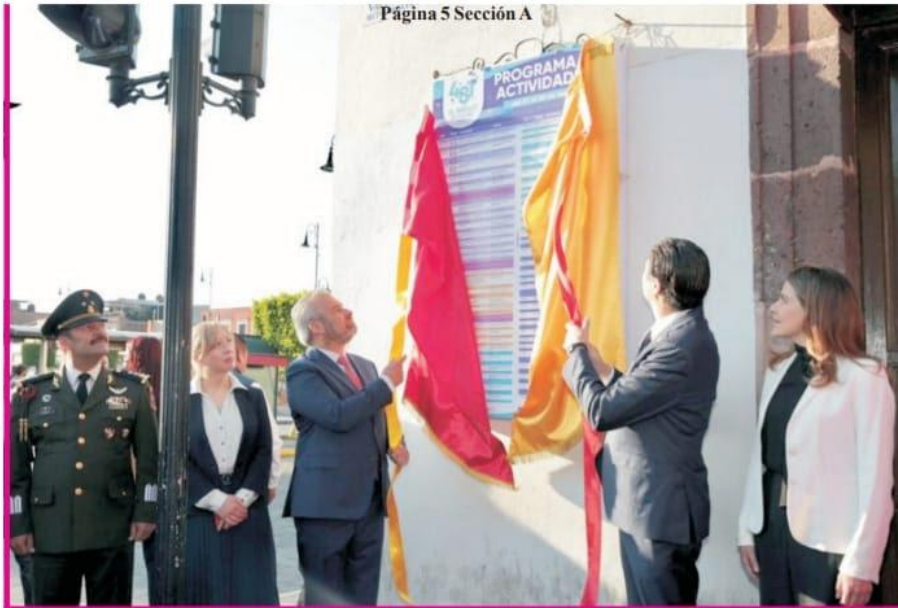
Página 5 Sección A