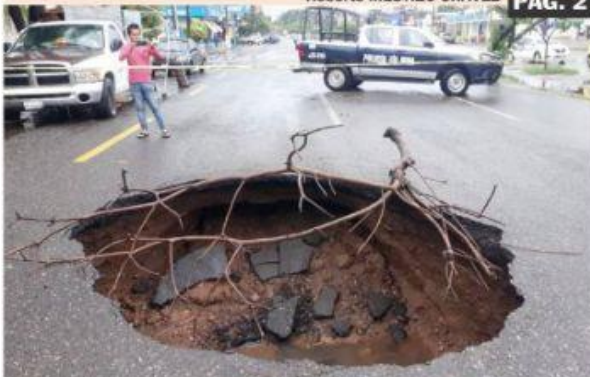
URUAPAN, MICH.-En los años recientes se han formado socavones en diversos puntos de la ciudad, agudizado por las constantes lluvias.