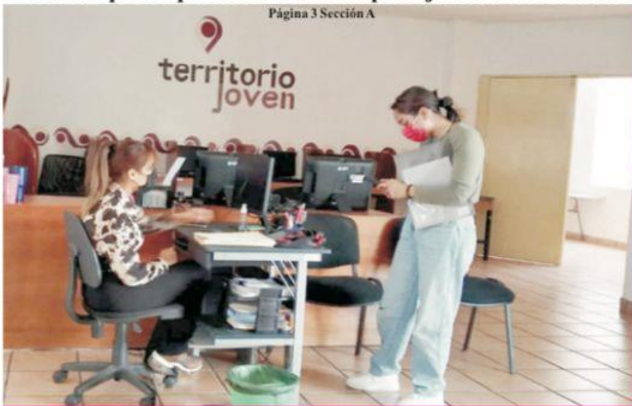
Página 3 Sección A