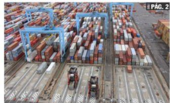
CD. LÁZARO CÁRDENAS, MICH.- El Puerto de Lázaro Cárdenas reportó un crecimiento del 46% en el manejo de carga contenerizada al mes de junio.

Puerto de Lázaro Cárdenas mueve 46% más de carga contenerizada al mes de junio PÁG. 2