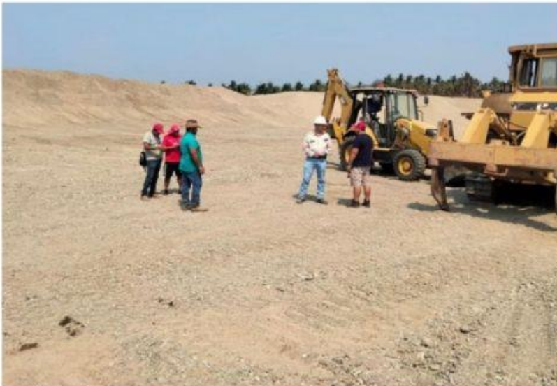
CD. LÁZARO CÁRDENAS, MICH.- La empresa acerera ArcelorMittal México arrancó la segunda fase de desazolve del río Acalpican.

Limpiarán alrededor de 36 mil metros cúbicos PÁG. 2