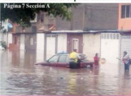
Página 7 Sección A