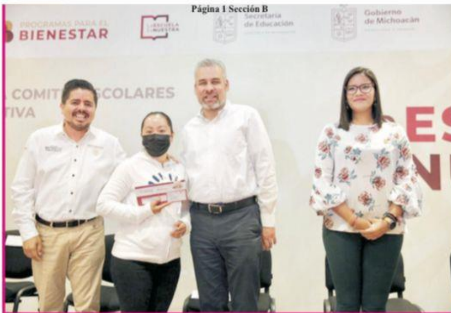
Página 1 Sección B