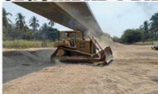
ArceMittal México desazolvará alrededor de 36 mil metros cúbicos del Río Acalpican.