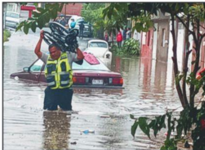
La gran cantidad de agua precipitada la tarde de este miércoles provocó inundaciones en colonias vulnerables de la capital del estado; decenas de vehículos y viviendas resistieron afectaciones.

Autoridades municipales tienen listo un albergue para activarlo en caso de ser necesario.