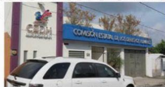
CEDH resolvió conflicto que vulneraba derechos humanos de la niñez.

La Comisión Estatal de los Derechos Humanos (CEDH) en Michoacán, resolvió un conflicto que venía vulnerando los derechos humanos de la niñez, hacien-