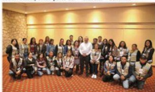
Al cierre del 2022, un total de 5 mil 566 escuelas serán beneficiadas en la entidad: Bedolla.