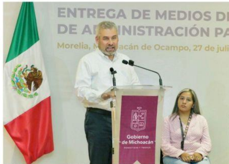
MORELIA, MICH.-El gobernador Alfredo Ramírez Bedolla, volvió a tocar el tema de las denuncias por presuntos desvíos de recursos durante el gobierno de Silvano Aureles Conejo.