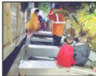
Elementos de bomberos asistieron en lanchas a familias cuyas viviendas fueron invadidas por el agua.