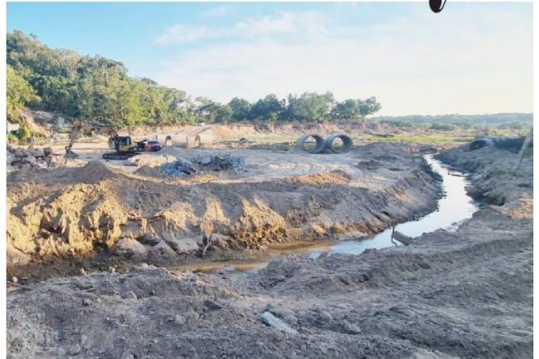
CD. LÁZARO CÁRDENAS, MICH.- Usuarios de la Unidad de Riego No.2 del Distrito 098 exigen que se dé continuidad a la reparación del sifón en Las Guacamayas, dado que la falta de agua se traduce en millonarias pérdidas para los productores agropecuarios.