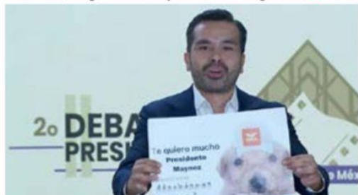
Jorge Álvarez Maynez, candidato presidencial de MC, durante el debate de ayer.