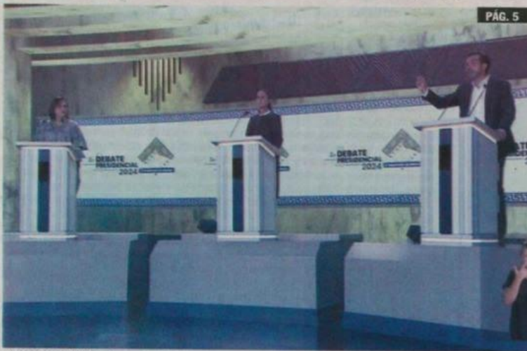
CIUDAD DE MÉXICO.- Ayer se realizó el segundo debate presidencial entre el candidato y las candidatas a la presidencia de la República, Jorge Álvarez Máynez de MC; Xóchitl Gálvez Ruiz, de PAN, PRI y PRD y Claudia Sheinbaum Pardo de Morena, PT y PVEM.

► Resurgen acusaciones directas de una, la otra y aquél, pero con réplicas sin convencimiento