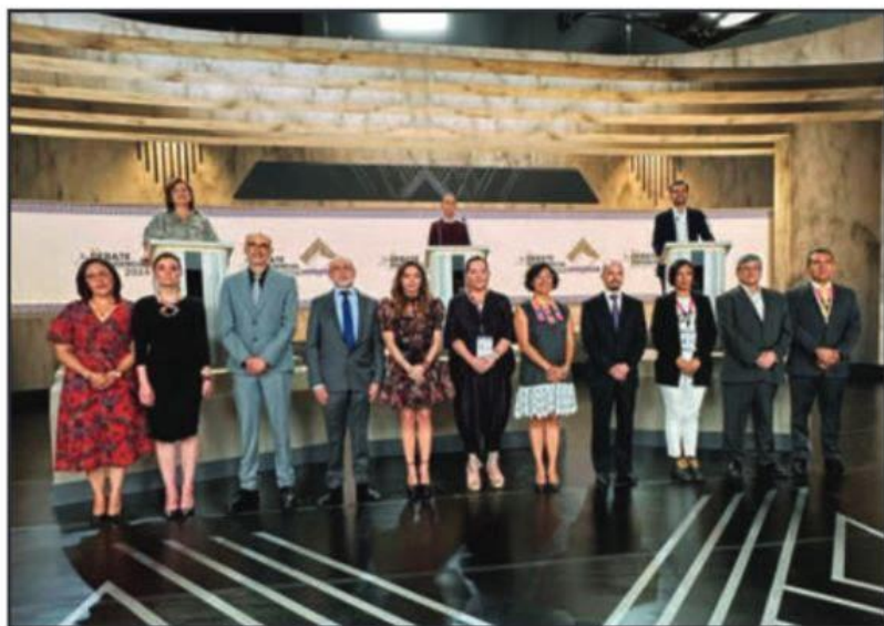
SE HA LLEVADO A CABO EL SEGUNDO DE LOS TRES DEBATES QUE ORGANIZARÁ EL INE, DE CARA A LA ELECCIÓN PRESIDENCIAL.