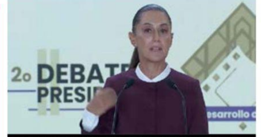
Claudia Sheinbaum, la candidata de Morena, PT y PVEM a la Presidencia de la República, durante su participación ayer en el segundo Debate Presidencial.