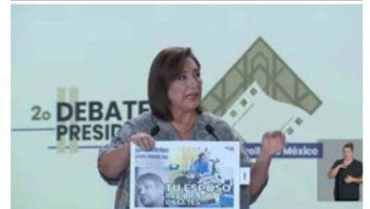
Xóchitl Gálvez, lanzó duras críticas a su oponente Claudia Sheinbaum anoche en el segundo debate de los candidatos a la Presidencia de la República.