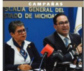
EL FISCAL VÍCTOR MANUEL SERRATO LOZANO DIO DETALLES DE DENUNCIAS DEL PROCESO ELECTORAL.