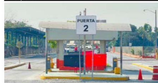
Obreros afiliados al sindicato minero, colocaron ayer las banderas rojinegra de huelga en ArcelorMittal, luego de una asamblea y marcha hacia la puerta 2, en demanda de un mejor reparto de utilidades 2023.