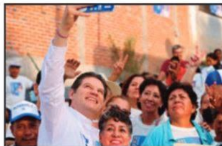
ALFONSO MARTÍNEZ PIDIÓ EL VOTO DE CONFIANZA EL 2 DE JUNIO.