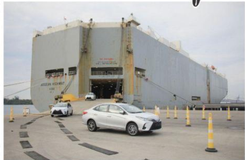
CD. LAZARO CÁRDENAS, MICH.- El puerto de Lázaro Cárdenas, reportó un aumento en las operaciones de carga automotriz realizadas al mes de junio de este ejercicio.

Semar convoca a personal civil a formar parte de sus filas, a través de diversos cuerpos y servicios