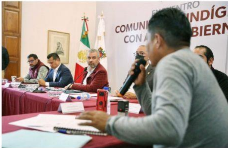
MORELIA, MICH.-El gobernador del estado, Alfredo Ramírez Bedolla, reiteró ayer su compromiso con las comunidades indígenas de Michoacán.