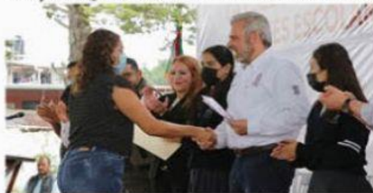
Un total de 19 escuelas del municipio son beneficiadas con este programa.

"Lo que se busca es brindar una educación digna, reducir las carencias y evitar el cobro de cuotas ➤ 3