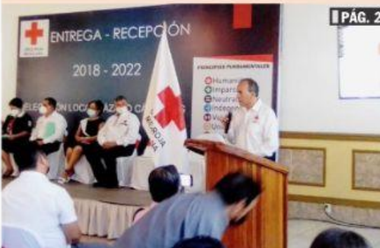
CD. LAZARO CÁRDENAS, MICH.- A nivel estado, la Cruz Roja tuvo una disminución en el número de servicios que se ofrecen a la sociedad, debido a la pandemia por Covid-19.