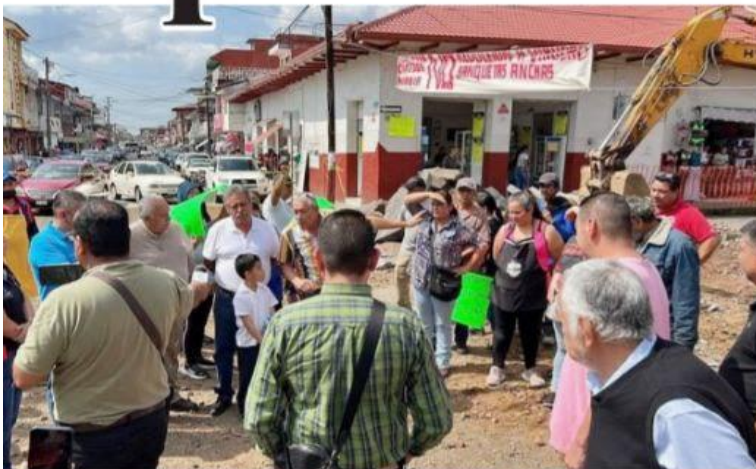
URUAPAN, MICH.-Comerciantes del área de la avenida Francisco Villa, se manifestaron en desacuerdo con la dimensión de las banquetas que ahí se construyen, pero el gobierno municipal ha expuesto que se trata de dar más seguridad a los peatones.

El gobierno municipal no cederá a presiones de unos pocos, que afectan a la mayoría