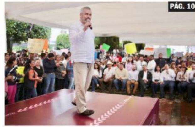
ARIO DE ROSALES, MICH.-El gobernador Alfredo Ramírez Bedolla, aseguró en este municipio, que Michoacán ha recuperado la seguridad.