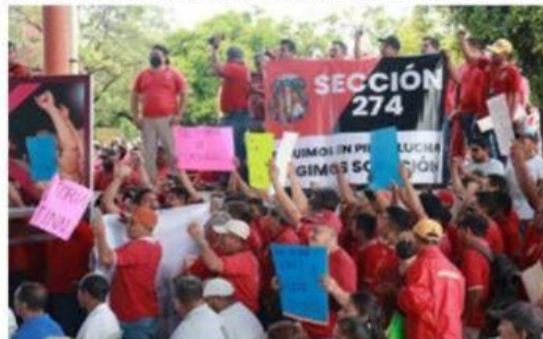
Trabajadores del Cobaem, exigieron ayer al gobernador Bedolla, el pago de prestaciones laborales.

Entre protestas y reclamos, Ramírez Bedolla visita Lázaro Cárdenas para informe regional