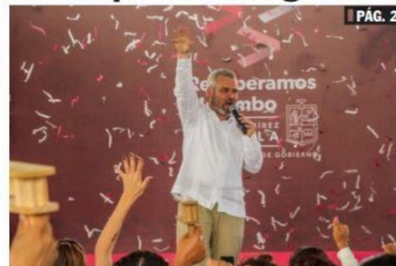
CD. LÁZARO CÁRDENAS, MICH.- El gobernador Alfredo Ramírez Bedolla rindió su informe regional en la Sierra-Costa, donde destacó de manera breve los avances obtenidos en materia de seguridad, educación y economía, afirmando que se combate a la delincuencia y a la corrupción.

Desde Lázaro Cárdenas, Bedolla presume combate a corrupción e inseguridad PÁG. 2