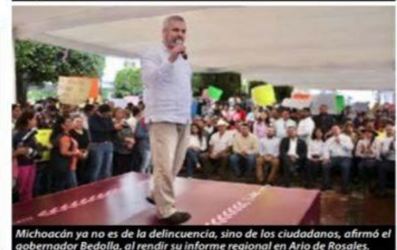
Michoacán ya no es de la delincuencia, sino de los ciudadanos, afirmó el gobernador Bedolla, al rendir su informe regional en Ario de Rosales.