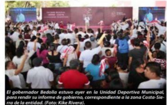
El gobernador Bedolla estuvo ayer en la Unidad Deportiva Municipal, para rendir su informe de gobierno, correspondiente a la zona Costa-Sierra de la entidad.

Por Francisco Rivera Cruz Entre manifestaciones de integrantes de la CNTE, Colegio de Bachilleres y trabajadores de la sección 274 del Sindicato Minero » 2