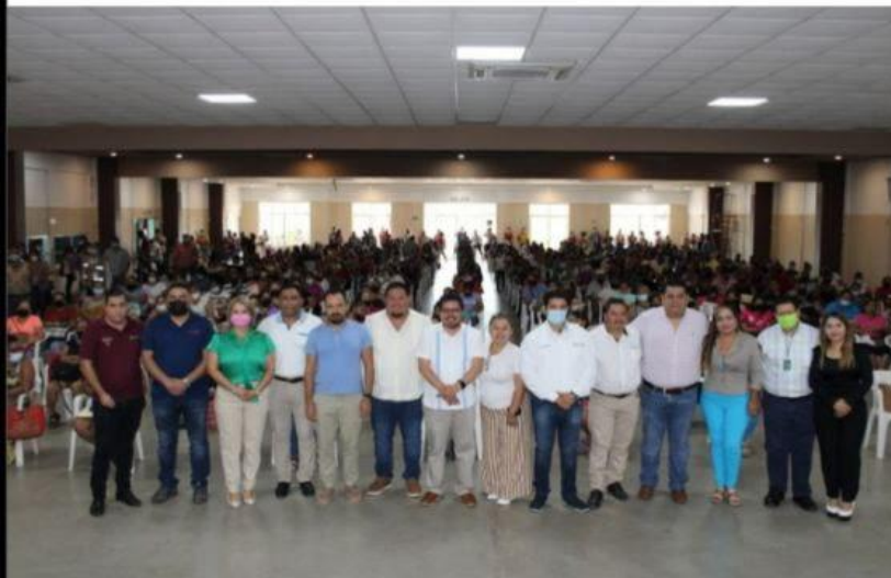
CD. LÁZARO CÁRDENAS, MICH.- Autoridades municipales, estatales y federales continúan con la entrega de tarjetas de las Becas "Benito Juárez".