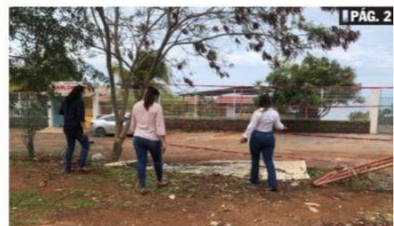
CD. LÁZARO CÁRDENAS, MICH.- El Puerto de Lázaro Cárdenas presentó a mes de mayo un incremento del 57% en el manejo de carga contenerizada.

Pocos daños en escuelas por las primeras lluvias: Ivón Carrillo PÁG. 2