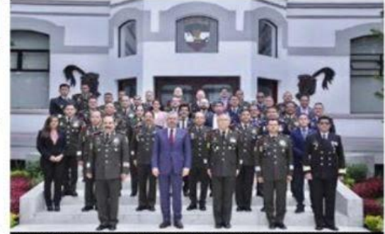
Al realizar ayer una conferencia en las instalaciones del Colegio de la Defensa Nacional, el gobernador Bedolla, anunció ante militares el inicio de un operativo interinstitucional de desarme en Michoacán.

El Puerto de Lázaro Cárdenas continúa operando de manera favorable y como resultado de ello, presenta al mes de mayo de este 2022, un incremento del 57% en el manejo de carga contenerizada al operar 853, 782 TEU'S que comparados con los 544, 477 TEU'S del mismo periodo, pero del 2021, es posible el crecimiento operativo. Del total de la carga el 21% corresponde a 177, 176 TEU'S en importación, el 19% comprende 165, 148 TEU'S de exportaciones y el 60% restante a operaciones de transbordo con 511, 458 TEU'S. Por otra parte, del total de la carga contenerizada se movilizó un» 8