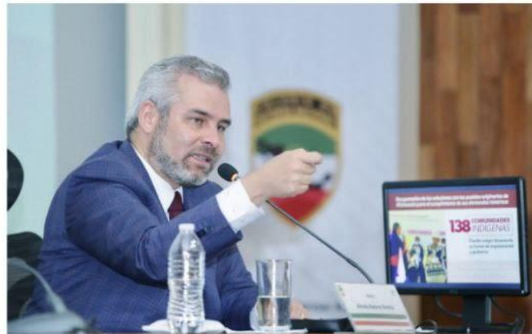
CIUDAD DE MÉXICO.-El gobernador del Estado, Alfredo Ramírez Bedolla, en la conferencia "La política de estado de Michoacán en materia de desarrollo y seguridad", en el Colegio de Defensa Nacional de la Sedena.

■ Polémico punto de acuerdo para desincorporar 727 bienes inmuebles, entre ellos 61 vehículos PÁG. 5