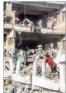
▲ Tras bombardeos de Israel a dos escuelas y un hospital ayer se reportaron 70 civiles muertos, la mayoría niños. Tel Aviv sostuvo que el ataque fue contra "puestos de mando de Hamas". En la imagen, el plantel escolar destruido el sábado en la ciudad de Gaza. Foto: Xinhua - AGENCIAS / P 23