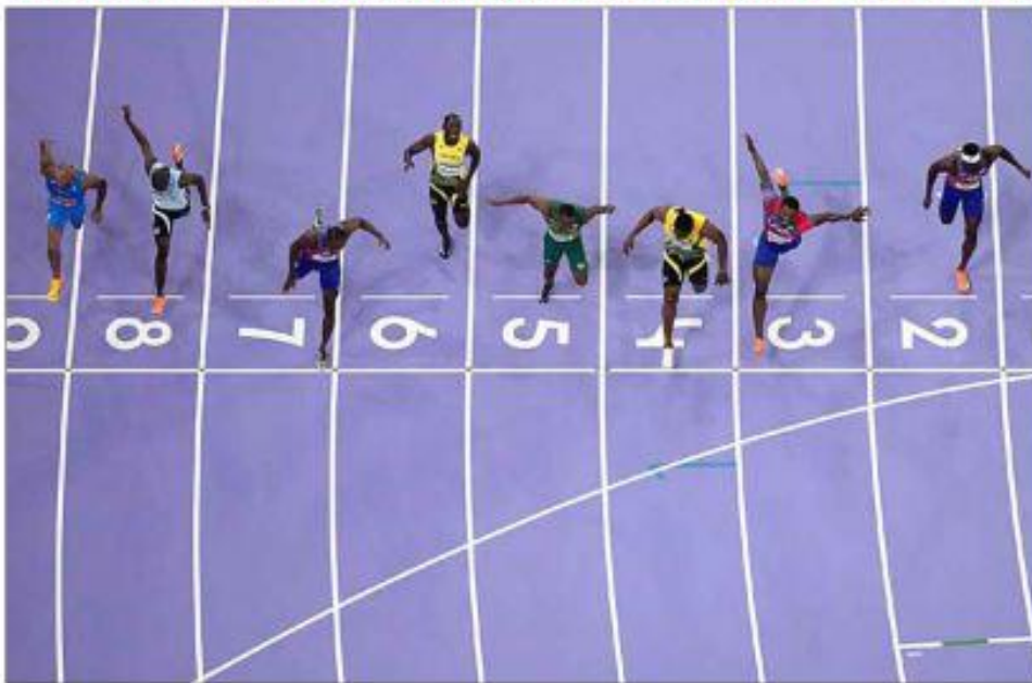
▲ La prueba de 100 metros planos de los Juegos Olímpicos de París 2024 tuvo que llegar al photo finish para determinar que el estadounidense Noah Lyles (carril 7) cronometró 9.79.784, por 9.79.789 del jamaícano Kishane Thompson (carril 4). El tercer sitio fue para