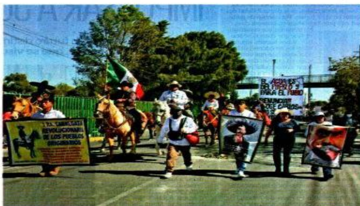
Habitantes de San Gregorio Atlapulco, en Xochimilco, mantienen vialidades bloqueadas en protesta.