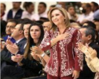
LA GOBERNADORA de Tlaxcala, ayer.

ES UNA ENTIDAD donde se puede estudiar, trabajar y tener salud, afirma la gobernadora en su primer informe; destaca ser un gobierno con sello de la 4T. pág. 7