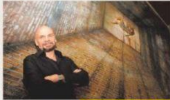
ARCHIVO CLAUDIO ESCOBAR

El artista plástico y muralista Rafael Cauduro falleció a los 72 años la noche del sábado. Hoy se le rinde homenaje en el Palacio de Bellas Artes. GOSSIP