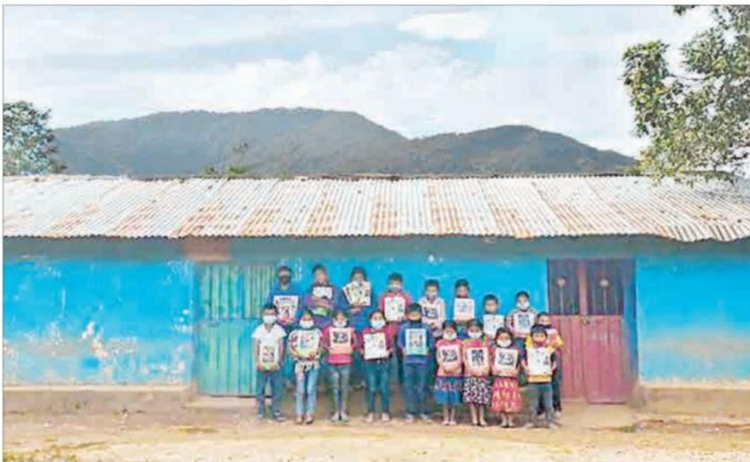
▲ Las escuelas de Cochoapa el Grande y Allixtac, en la Montaña Alta de Guerrero, carecen de equipamiento. "En los planteles multigrado se atiende a niños y adolescentes y, muchas veces, ni el pizarrón

sirve, porque de tan viejo ya no se puede escribir en él", narran los educadores. "Hay tanta miseria que los alumnos sólo comen tortilla con chile, aunque trabajen de sol a sol".