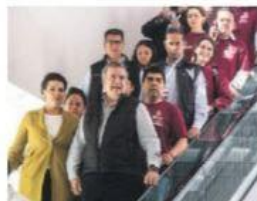
PREPARADO. Dijo que todos estuvieron por propia decisión, no por la fuerza.