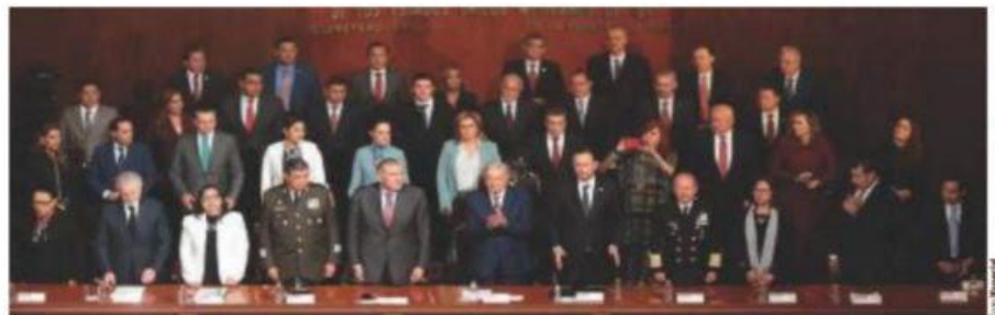
EL PRESIDENTE, los representantes de los poderes Judicial y Legislativo y los gobernadores del país, ayer, en Querétaro.

"EL HUMANISMO mexicano expresado por el Ejecutivo es un concepto válido, sustentado en la razón jurídica y en la esencia de estas modificaciones (constitucionales) que hemos hecho a favor de los mexicanos" Alejandro Armenta Presidente del Senado de la República