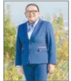
La secretaria de Seguridad Pública Ciudadana, durante la entrevista con La Jornada.

Rosa Icela Rodríguez: “no me he olvidado de la CDMX”