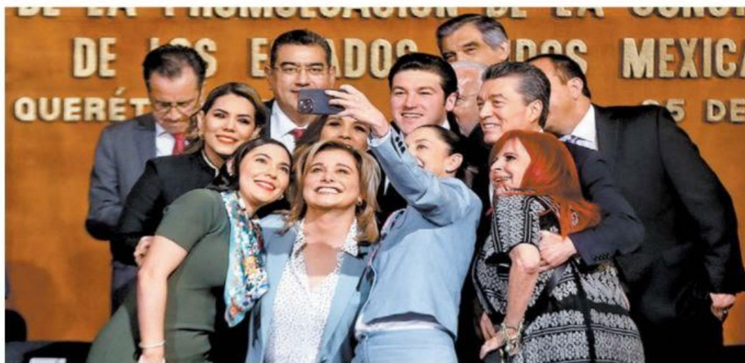
Claudia Sheinbaum organizó la selfi entre gobernadores asistentes a la ceremonia.