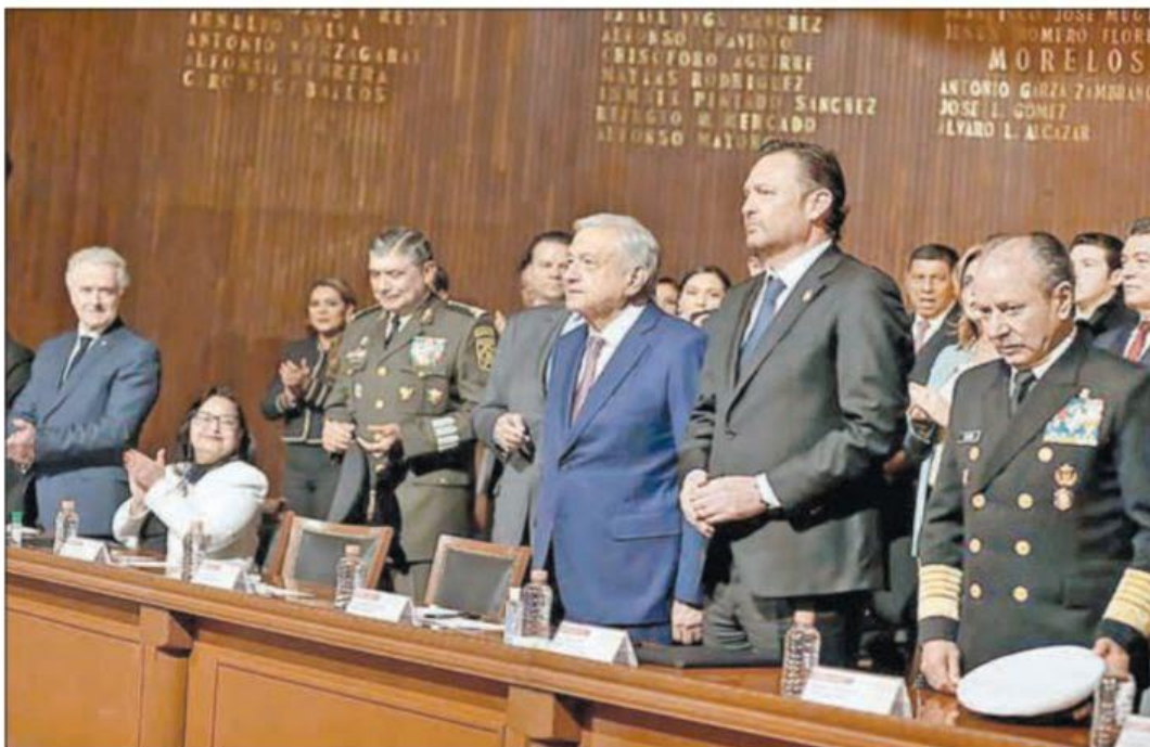
▲ Durante la ceremonia por el 106 aniversario de la Constitución en el emblemático Teatro de la República, en Querétaro, la ministra presidenta del máximo tribunal del país rompió los protocolos del

Desdén de la titular de la SCJN al Presidente