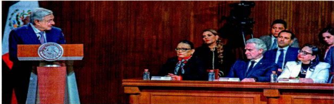
El presidente Andrés Manuel López Obrador ayer en su participación en la ceremonia; lo escuchan, entre otros, Santiago Creel y Norma Piña.