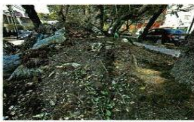
Estado de una de las obras modificadas por la Alcaldía.

La Sedena también agusta, por 15 camionetas SUV con blindaje Nivel V Plus, el cual soporta ataques con fusiles de asalto calibre 7.62, por un costo de entre 50 y 55 millones de pesos.