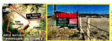
Tras ser cerrado un tiradero clandestino, rellenaron un predio en el Área Natural para lotificarlo.

De acuerdo con la Asociación Mexicana de Reciclaje de Residuos de Construcción y Demolición (AMBCD), la Ciudad de México se encuentra en crecimiento constante y el problema es dónde depositar las más de 14 mil toneladas de desperdicio de