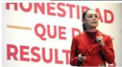
LA JEFA de Gobierno, ayer.

SHEINBAUM destaca en informe que en 4 años se pasó de la corrupción a un gobierno honesto; le gritan “¡presidenta!”. pág. 12