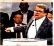
Monreal y el Gobernador Julio Menchaca.

El coordinador en el Senado señaló como uno de los responsables al delegado de programas sociales