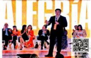
El Gobernador de NL participó en la convención de MC.