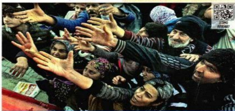
ENTRE ENOJO Y DESESPERANZA Tras el terremoto, la cifra de muertos en Turquía y Siria rebasa los 15 mil y la ira entre pobladores crece por falta de equipos de rescate. Los sobrevivientes hacen fila para conseguir viveres. INTER (PÁG. 13)

WASHINGTON- El Gobierno del Presidente Andrés Manuel López Obrador negocia un acuerdo con la administración del Presidente Joe Biden para que Estados Unidos pueda llevar a cabo deportaciones masivas de migrantes de terceros países