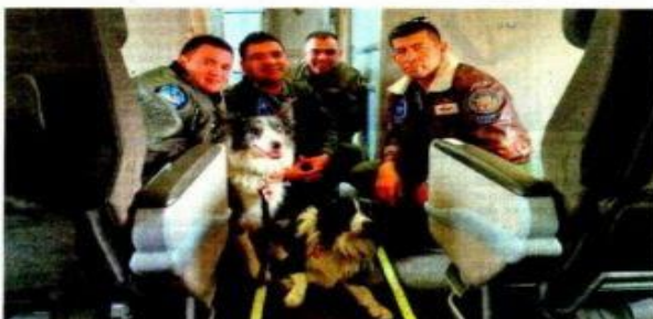
IMAGEN DEL DÍA LLEGA LA AYUDA MEXICANA

El equipo de México para auxiliar en la búsqueda y rescate de personas tras los terremotos que impactaron Turquía y Siria llegó a Adiyaman, en el primer país. Con ellos viajan varios perros especializados, como Bolom y Orly (foto), que posaron con personal de la Cruz Roja en una escala en Toronto. | MUNDO | A18