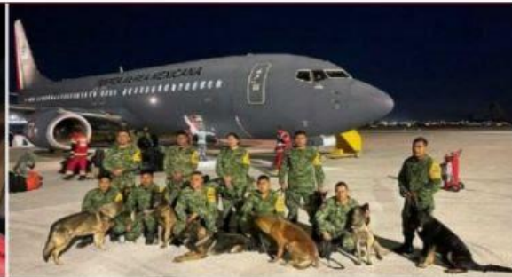
BINOMIOS caninos del Ejército enviados para ayudar en Turquía, ayer.