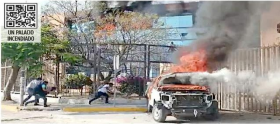
Los estudiantes quemaron una docena de vehículos oficiales.