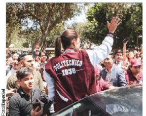
SHEINBAUM, ayer, en el Politécnico.

EL PRESIDENTE dice que estuvo quejoso; también pide respetar lo planeado por INE; persisten críticas a producción.