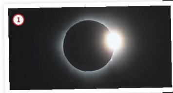
1 PERLAS de Bailly y el anillo de diamantes.