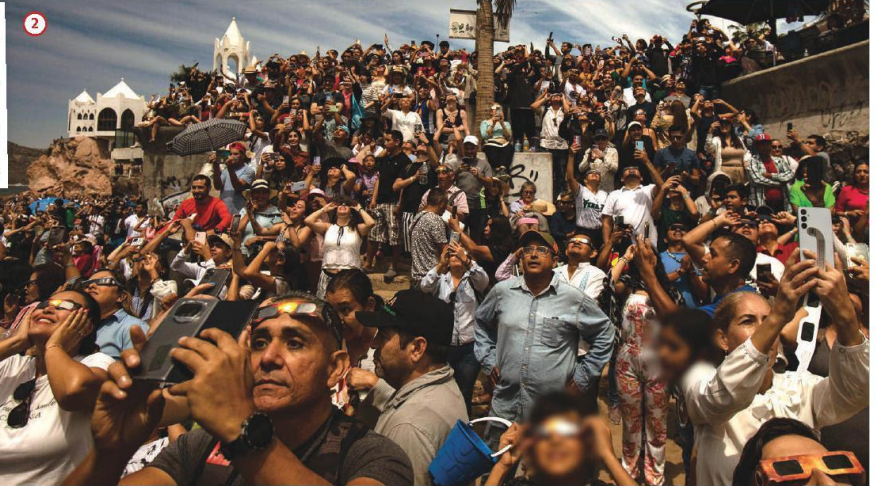
2 MILES abarrotaron la playa en Mazatlán, ayer.