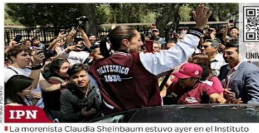
La morenista Claudia Sheinbaum estuvo ayer en el Instituto Politécnico Nacional.