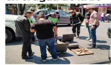
Además del análisis de la calidad de agua, se realiza desazolve del drenaje.