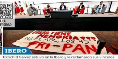
Xóchitl Gálvez estuvo en la Ibero y le reclamaron sus vínculos con priistas y panistas.