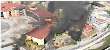
También lanzaron bombas molotov y provocaron incendios en las oficinas del Palacio de Gobierno de Guerrero.

estacionamiento y otro en el acceso principal del Palacio.