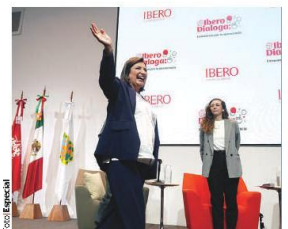
XÓCHITL Gálvez, ayer en la Ibero.

REGISTRAN 94 millones de intrusiones maliciosas en 2023; 257 mil diarias; falta de ley y uso de IA facilita fraudes, señalan expertos. pág. 9