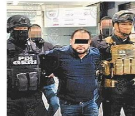
Entrega en Cdmx. ESPECIAL

ALMA P. WONG Y CARLOS VEGA, CDMX El gobernador de Morelos, Cuauhtémoc Blanco, explica que no puede remover al fiscal y deja el tema al Congreso. PÁGS. 6 A 8