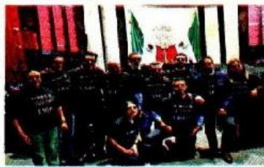
La bancada del PAN subió a la tribuna para criticar los recortes, la de MC se puso playeras negras con frases de respaldo al INE.