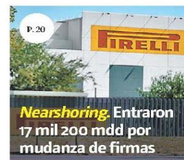
P. 20 Nearshoring. Entraron 17 mil 200 mdd por mudanza de firmas

EQUIPO MILENIO, CDMX Abner, de seis años, murió a causa de "asfixia por sumersión" en las instalaciones del colegio en San Jerónimo. PÁGS. 12 Y 13