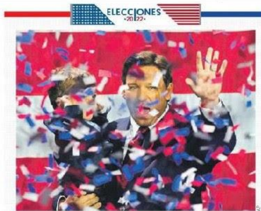
36 GOBERNADORES. Republicanos llevaban 14 estados, los demócratas 6.