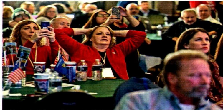
Republicanos observan con desánimo que la marea roja no se cumplía en los comicios de medio término.

El Congreso de Estados Unidos ● DEMOCRATAS ● REPUBLICANOS ● INDEFINIDOS