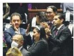
DIPUTADOS. Iniciarán jornadas para discutir más de 2 mil reservas.

Con 273 votos a favor y 222 en contra, el pleno de la Cámara de Diputados aprobó, en lo general, el Presupuesto de Egresos 2023. Morena, PVEM y PT avalaron el dictamen, mientras que PAN, PRI, MC y PRD votaron en contra. A partir de hoy, el plenario batirá por 10 horas diarias las más de 2 mil 400 reservas. —V. Chávez / F. Gascón / PÁG. 35