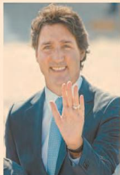
Justin Trudeau, PRESIDENTE DE CANADÁ.

México debe permitir la inversión privada para la extracción de minerales "críticos" como el litio y el petróleo".