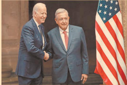
Encuentro. El presidente López Obrador y Joe Biden se reunieron ayer en Palacio Nacional.

Es momento de terminar con ese 'desdén' hacia AL y el Caribe opuesto a la política de la buena vecindad".