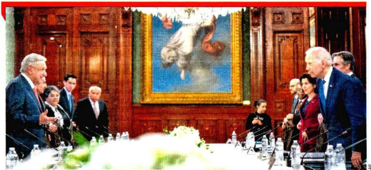
PALACIO NACIONAL. Hay condiciones inmejorables para consolidar la integración de América: AMLO a Biden.