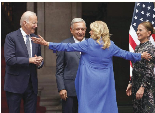
LOS PRESIDENTES de México y EU y sus esposas se abrazan tras recepción protocolaria.

PRESIDENTES muestran calidez reforzada con gestos de esposas; AMLO pide fin al desdén hacia AL; “tiene la llave para mejorar relación con países”