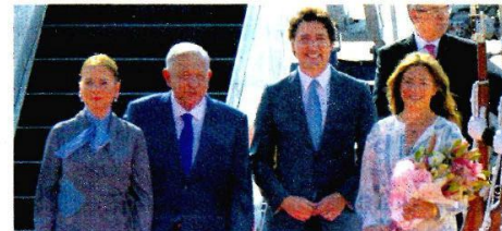
BIENVENIDA. Justine Trudeau aterrizó ayer en la tarde; también llegó al AIFA.

Ayer, los mandatarios AMLO, Joe Biden y Justine Trudeau, quien recién llegó, cenaron en Palacio Nacional en el marco de la Cumbre de Líderes de América del Norte. En la tarde, AMLO y Biden tuvieron una reunión bilateral. El primero pidió mayor colaboración con la región, mientras que Biden le dijo que han realizado proyectos con el hemisferio, pero que EU tienen un compromiso multiregional. En un comunicado, la Casa Blanca informó que México y EU acordaron tener mayor cooperación para castigar a narcotraficantes y redes del crimen organizado. — Diana Benitez / PÁGS. 24 Y 25