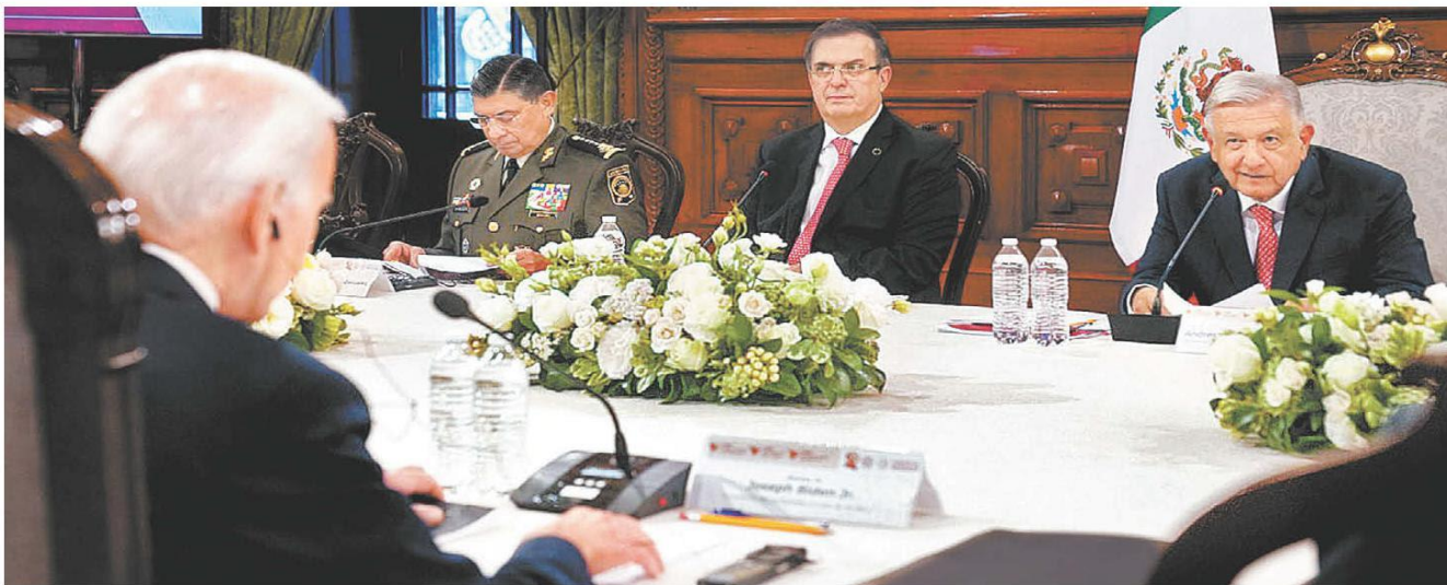
Los mandatarios tuvieron un recorrido por Palacio Nacional, una reunión bilateral y una cena en el contexto de la cumbre de Norteamérica. ESPECIAL