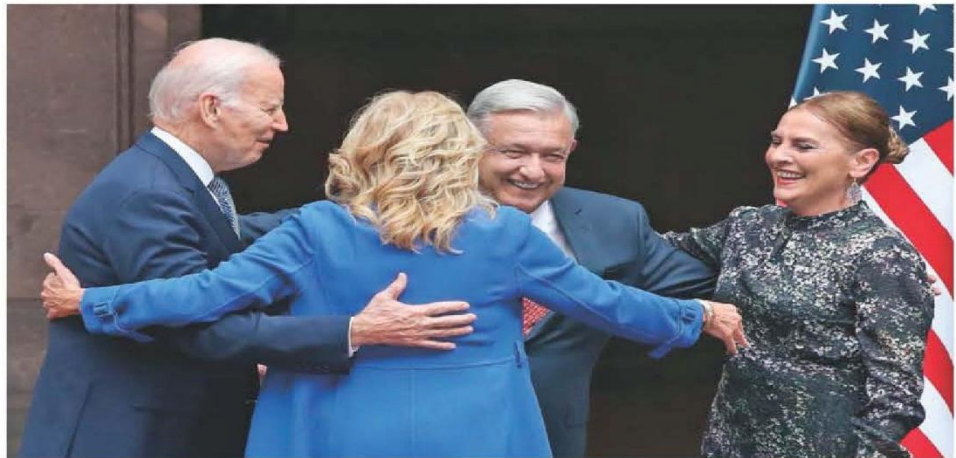
Los presidentes de EU, Joe Biden, y de México, Andrés Manuel López Obrador, junto con sus esposas Jill Biden y Beatriz Gutiérrez en el patio central de Palacio Nacional.