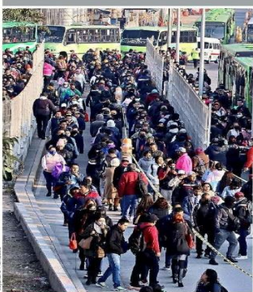
LENTO VIAJE. Miles de personas se vieron afectadas por el cierre de 4 estaciones de la L3 del Metro. El servicio alterno de camiones no fue suficiente ante la demanda.