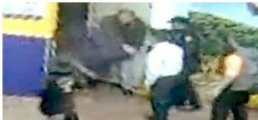
Los empleados golpearon y luego bajaron por un elevador a uno de sus clientes, quien falleció minutos después.

Para hoy se prevé un encuentro bilateral México-Canadá entre López Obrador y Trudeau, quien apenas el viernes cuestionó la política energética de México. Más tarde se realizará la cumbre trilateral norteamericana con los tres gobernantes.