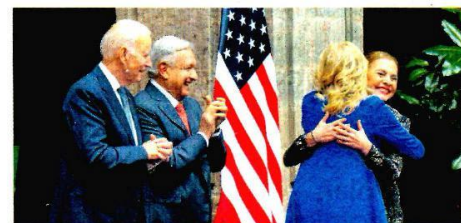
VÍNCULOS. Esposas de AMLO y Biden cierran en Palacio eventos juntas.

JILL Y BEATRIZ DAN DISCURSO CONJUNTO CONTRA RACISMO, XENOFobia Y CLASISMO. / PÁG. 24