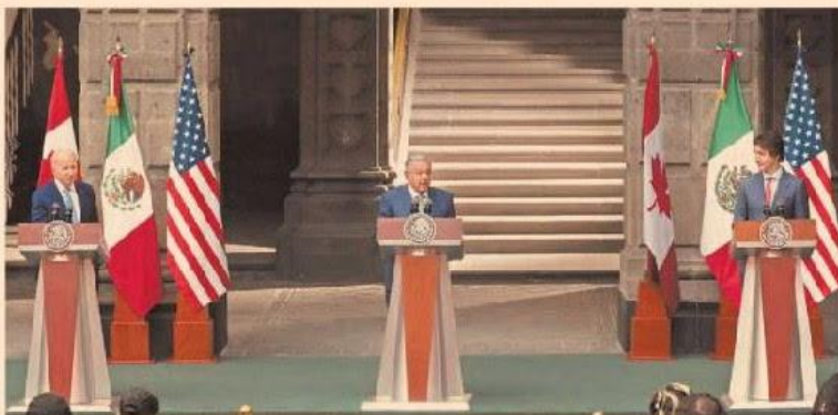
Acuerdo. Los tres países se comprometieron a trabajar por un mejor futuro para América del Norte.