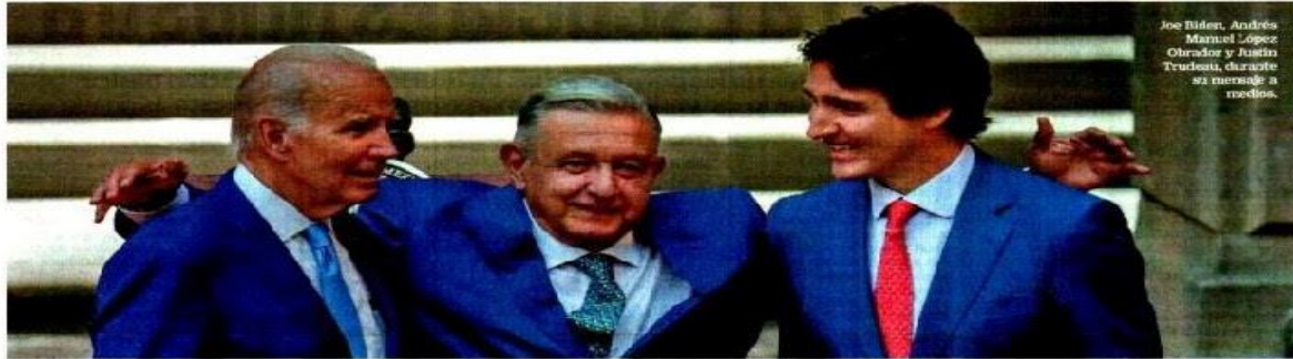
Joe Biden, Andrés Manuel López Obrador y Justin Trudeau, durante su mensaje a medios.

México, EU y Canadá acuerdan trabajar en conjunto por la autosuficiencia de América del Norte; AMLO niega que se vaya a crear un centro migratorio