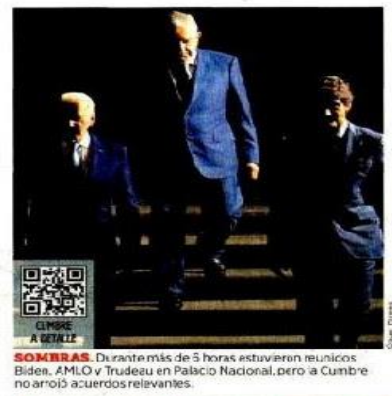
SOMBRAS. Durante más de 5 horas estuvieron reunidos Biden, AMLO y Trudeau en Palacio Nacional, pero a Cumbre no arrojó acuerdos relevantes.

Eiden y Trudeau comentaron en su mensaje inicial