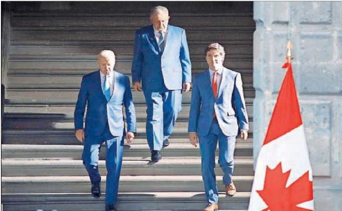
▲ Los presidentes de México y Estados Unidos, Andrés Manuel López Obrador y Joe Biden, respectivamente, así como Justin Trudeau, primer ministro de Canadá, se dirigen al patio central de Palacio