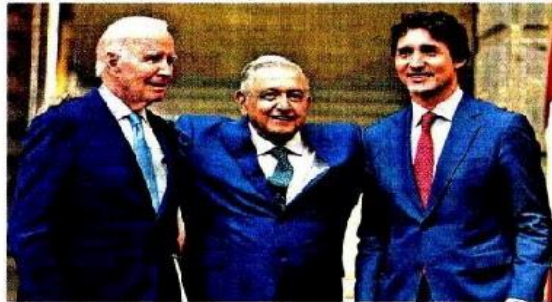
Joe Biden, Andrés Manuel López Obrador y Justin Trudeau se tomaron la foto oficial de la Cumbre de Líderes de América del Norte luego de que cada uno de los mandatarios dio un mensaje en Palacio Nacional.

El combate a la producción y tráfico de fentanilo ya no es sólo una prioridad para Estados Unidos, sino para también para sus socios en el T-MEC. México, EU y Canadá acordaron trabajar juntos contra las drogas sintéticas, continuar con el diálogo sobre este problema y buscar una colaboración global más amplia sobre esta amenaza mundial.