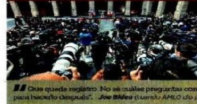
Y MONTA SU 'MAÑANERA' Tiempo de discursos y respuestas en conferencia de prensa.

la transición de impulsar la transición hacia vehículos eléctricos, disminuir las emisiones y cumplir con los acuerdos de París, para hacer frente al cambio climático. "Trudeau fue el más insistente en la urgencia de conseguir una economía fuerte, pero limpia. "Podemos impulsar nuestra resiliencia económica aún más mediante nuestro trabajo para crear una economía limpia, cosas como la energía limpia, incluido el hidrógeno, la fabricación de vehículos de emisión cero y alentar a