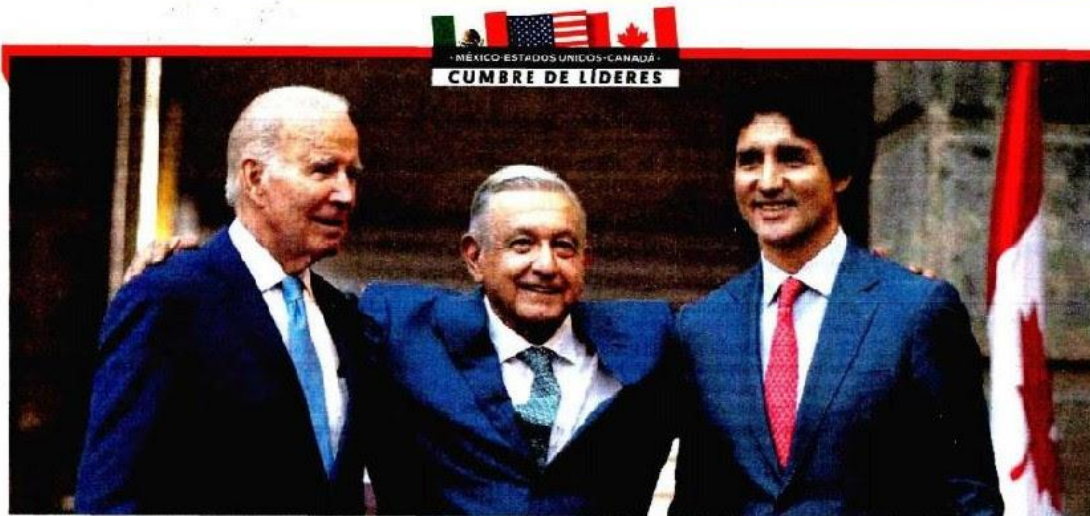
LOS TRES AMIGOS. Entre elogios, el presidente AMLO agradeció a Joe Biden y Justin Trudeau su buena vecindad en la Cumbre de América del Norte.