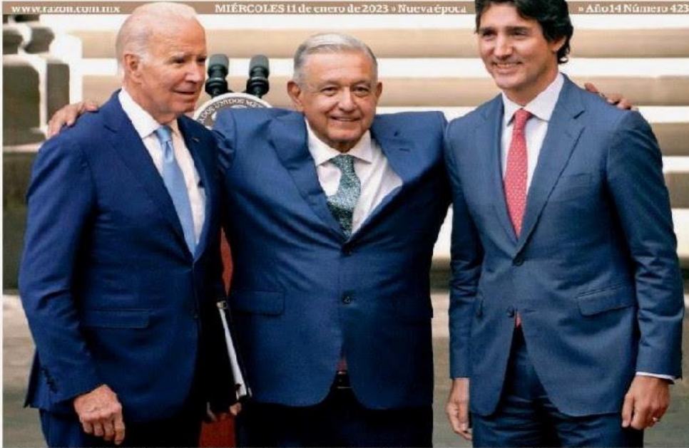
LOS PRESIDENTES de EU, Joe Biden; de México, Andrés Manuel López Obrador, y el primer ministro de Canadá, Justin Trudeau, ayer.

EVITAN LOS "TRES AMIGOS" DIFERENDO ENERGÉTICO