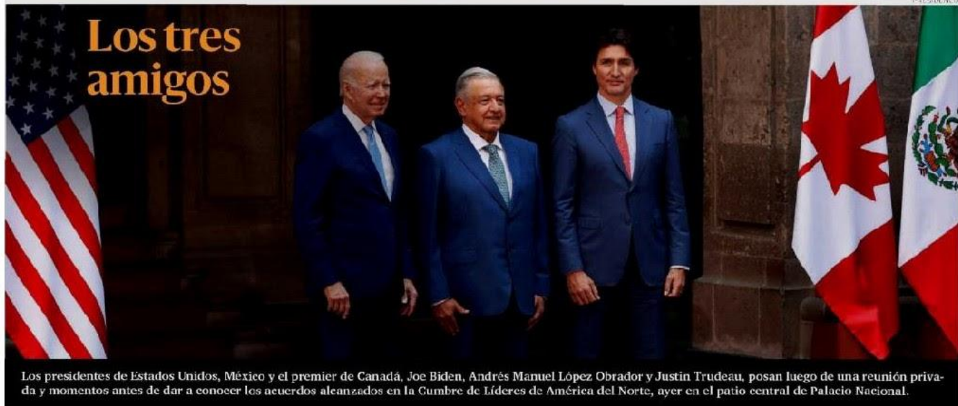
Los presidentes de Estados Unidos, México y el premier de Canadá, Joe Biden, Andrés Manuel López Obrador y Justin Trudeau, posan luego de una reunión privada y momentos antes de dar a conocer los acuerdos alcanzados en la Cumbre de Líderes de América del Norte, ayer en el patio central de Palacio Nacional.

PRESIDENTE DEL CONSEJO DE ADMINISTRACIÓN: JORGE KAHWAGI GASTINE // DIRECTOR GENERAL: RAFAEL GARCÍA GARZA // AÑO 26 - N° 5485 - $19.00 // MIÉRCOLES 11 ENERO 2023 // WWW.CRÓNICA.COM.MX