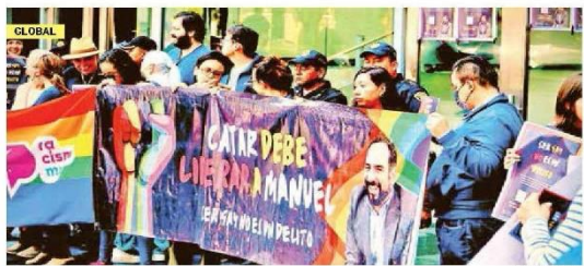
PRESEN EN QATAR