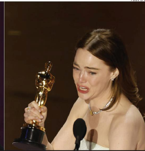
Cillian Murphy y Emma Stone ganaron este domingo los premios a Mejor Actor y Mejor Actriz en la edición 96 de los premios de la Academia de Hollywood. Mientras que el cineasta Christopher Nolan cosechó su primer Óscar a Mejor Director por "Oppenheimer", filme que arrasó en la premiación. PÁGS 26-27

"Oppenheimer", el gran vencedor: gana siete Oscar