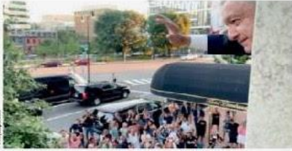
EL PRESIDENTE, ayer saluda a paisanos en EU.