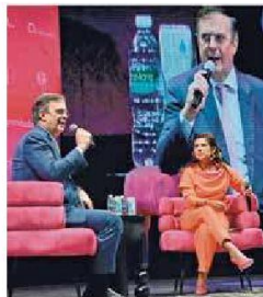
Mensaje. Nada en la reforma pudiera poner en riesgo una sola inversión.

AFECTARÍA CALIFICACIÓN ALERTA MOODY'S DE DEBILIDAD INSTITUCIONAL POR REFORMA JUDICIAL. PÁG. 7