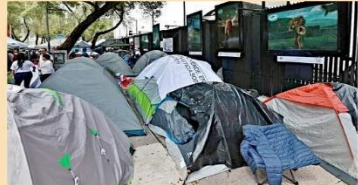
El Senado amaneció encadenado y con un plantón afuera.

Sólo las Ministras Loreta Ortiz y Lenia Batres, abiertas militantes de Morena, festejaron en sus redes sociales la aprobación de la reforma judicial. La Ministra Yasmín Esquivel, quien ha sido crítica de la gestión