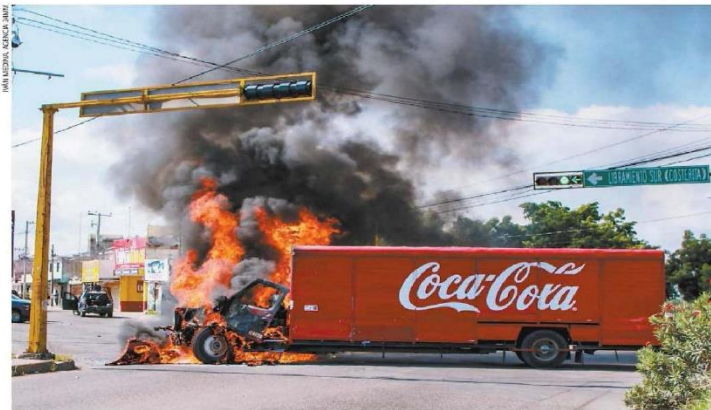
Un camión repartidor de refrescos fue incendiado y usado para bloquear un bulevar.

Enfrentamientos y bloqueos no cesan; reportan 9 muertos y 14 desaparecidos en 3 días