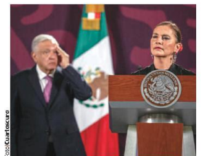
ANDRÉS Manuel López Obrador y su esposa Beatriz Gutiérrez Müller, ayer.