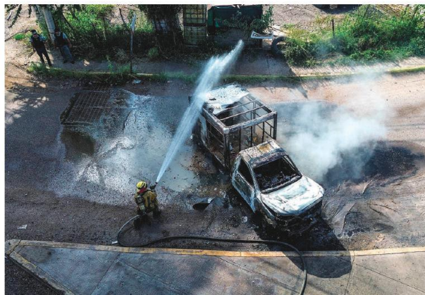
UNO de los vehículos incendiados, ayer en Culiacán.

...Y EN LA UAS naufraga su consulta para votar al rector; estudiantes la desairan; en mesas instaladas por el Congreso no había notario. págs. 15 y 16