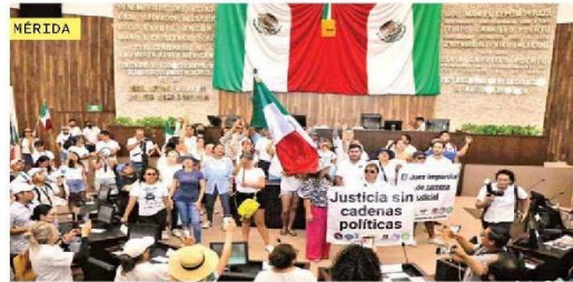
Trabajadores judiciales irrumpieron en el salón de plenos del Congreso de Yucatán, que tuvo que suspender la sesión; más tarde, dio luz verde al dictamen con 19 votos en favor y 16 en contra.

Durango fue el único estado con gobierno opositor que aprobó la reforma, con votos del PRI. El Congreso de Querétaro rechazó el dictamen desde que fue recibido en comisiones.