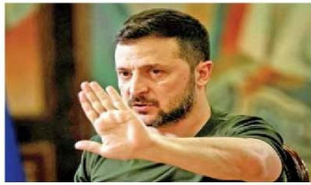
Zelenski impulsa una cumbre entre su país y América Latina, para mejorar el entendimiento de lo que sufren en la guerra con Rusia.