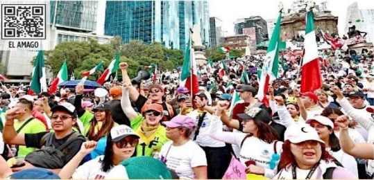
Jueces y trabajadores del Poder Judicial marcharon hasta el Senado en protesta por la reforma constitucional.