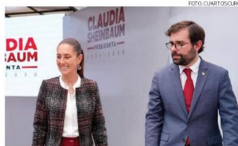
Alejandro Svarch fue presentado en la casa de transición de Sheinbaum.

Alejandro Svarch Pérez, actual director de Cofepris, fue designado como el próximo titular del IMSS-Bienestar y tendrá en sus manos la tarea de materializar los proyectos del fallido Insa-si, entre ellos la compra de medicamentos en el extranjero, así como el reparto y distribución de