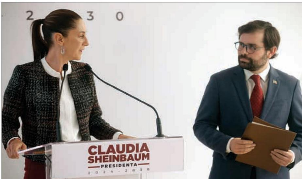
▲ La virtual presidenta electa, Claudia Sheinbaum, dio a conocer ayer que, durante su gobierno, el actual titular de la Cofepris será el encargado de impulsar la unificación de los servicios de salud. Destacó que se trata de una "nueva visión, donde la atención sanitaria es un derecho y no una