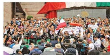
Trabajadores del Poder Judicial y jueces protestaron ayer en las escalinatas del Palacio de Justicia Federal de San Lázaro.