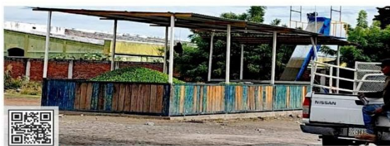
Limoneros de Apatzingán y Buenavista frenaron su producción. El crimen les pide 5 pesos por cada kilo que venden.

Según registros ministeriales en la Tierra Caliente de Michoacán operan células criminales de Los Viagras, Los Caballeros Templarios y el Cártel Jalisco Nueva Generación (CJNG), que buscan