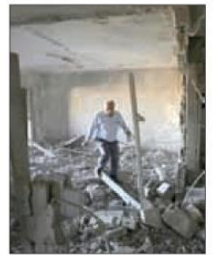
▲ La ofensiva israelí también se ha dirigido a Cisjordania. En la imagen, Ramallah.

Washington avala nueva venta de armas a Tel Aviv por 20 mil mdd