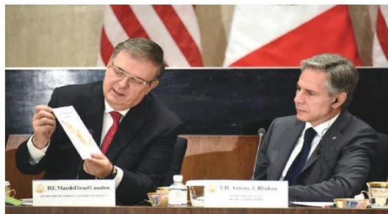
EBRARD muestra en reunión donde participaron 5 secretarios de México y 3 de EU, el origen de las armas que llegan aquí.

EN DIÁLOGO de Alto Nivel Ebrard exhibe origen de armamento que llega acá; decomisan 32 mil; justifica a GN, "imposible que viole derechos" pág. 3