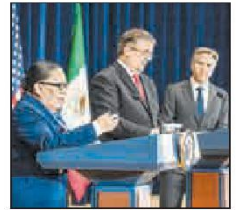
Rosa Icela Rodríguez, Marcelo Ebrard y Antony Blinken ofrecieron conferencia tras la reunión del Diálogo de Alto Nivel en Seguridad.

López Obrador enlista a 43 presidenciables de la oposición