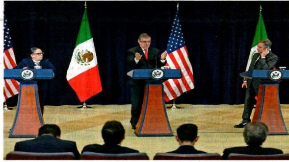
Rosá Icela Rodríguez, titular de Seguridad, el canciller Marcelo Ebrard y Antony Blinken, secretario de Estado.