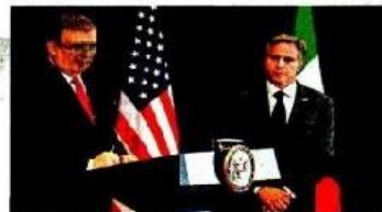
Ebrard y Blinken encabezaron el Diálogo de Alto Nivel, en EU.

El secretario de Estado de EU, Antony Blinken, reconoció que hace falta trabajo de su gobierno contra el tráfico de armas. PRIMERA | PÁGINA 5