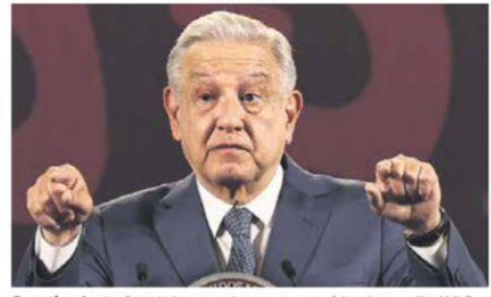
Garantiza abasto. Se trabaja en un plan para que no falte el agua, dijo AMLO.

INDICADOR OPORTUNO DEL INEGI Habría tenido consumo privado avance suave a principios de 2024. PÁG. 5