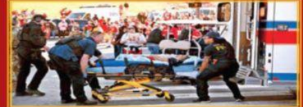
Se calcula que el desfile tuvo un millón de asistentes. Al escuchar los disparos, cientos buscaron guarecerse en las propias calles.