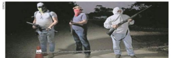
Pobladores controlan el paso a Frontera Corozal, en Chiapas, para protegerse del crimen.