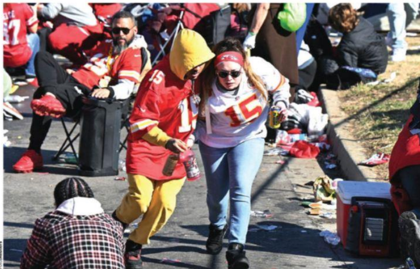
SEGUIDORES de Kansas City abandonan el sitio donde se realizó el desfile por el bicampeonato de la NFL tras los disparos.

GABRIEL MORALES La extrema derecha en contra de la liberación de los rehenes pág. 26