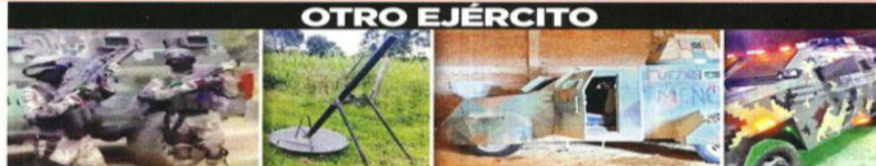
Grupos del Cártel Jalisco Nueva Generación (CJNG) buscan impedir el acceso del Ejército a la zona de Tierra Caliente.