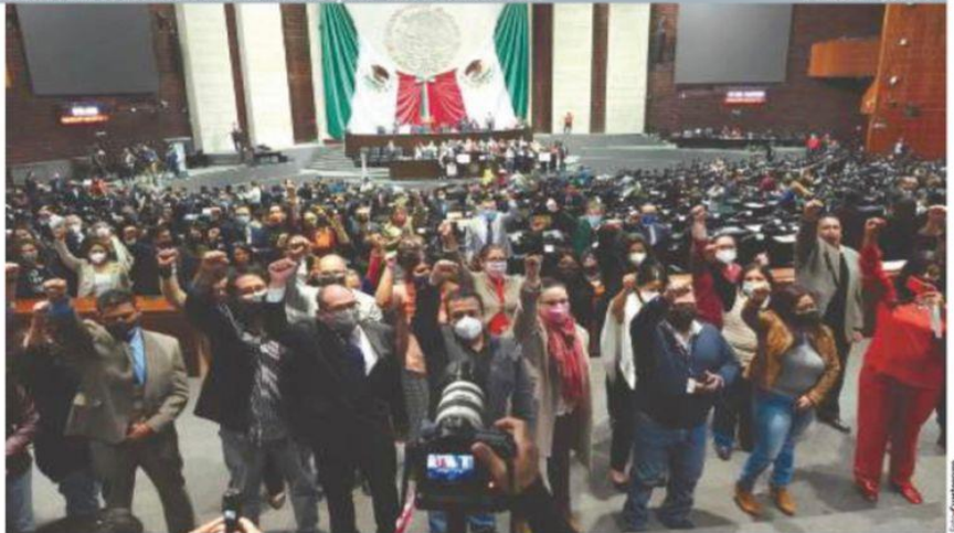
REPORTEROS, fotógrafos y camarógrafos dan la espalda a la Tribuna en Diputados como protesta contra agresiones al gremio.

DEMANDAN QUE SE PUEDA EJERCER LABOR SIN AMENAZAS