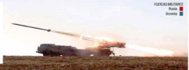
FUERZAS MILITARES Rusia Ucrania