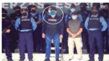
JUAN ORLANDO Hernández, ayer, tras su captura en su casa.

Expediente en EU señala que desde la presidencia conspiró para transportar cocaína desde Venezuela y Colombia; presuntamente recibió del Cártel de El Chapo 1 mdd que usó en campaña de reelección. pág. 19