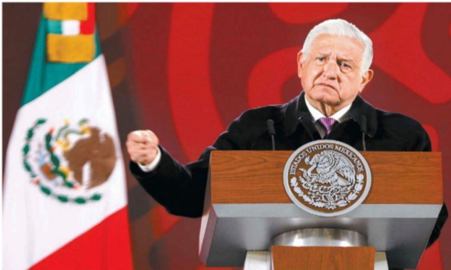
El Presidente se dice "agradecido con el creador" de que sus muchachos "no pinten para conservadores". ARACELI LÓPEZ

Reforma en la Cámara Avalan comandancia del Ejército y Estado Mayor FERNANDO DAMIAN - PÁG. 11