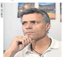
Leopoldo López vive en España desde 2020, con su familia.