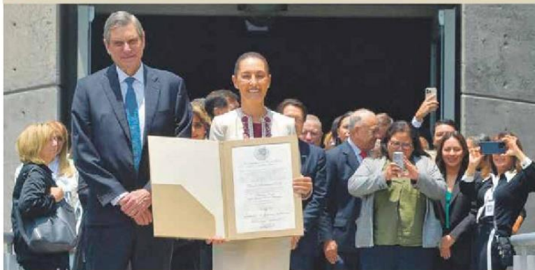
Primera mujer en la Presidencia. Sheinbaum muestra la constancia que la acredita como presidenta electa de México.