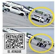
EL ATaque La FGR aseguró que el avión que trasladó al 'Chapitel' y 'Mayo' tenía autorización de EU.

Para la FGR, el traslado de Ismael "El Mayo" Zambada se realizó en un avión con matrícula clonada, cuyo pilotaje ocultó la información del vuelo al territorio nacional. A pesar de que hicieron 11 pedidos de información al Departamento de Estado de Estados Unidos, los estadounidenses no le han proporcionado ningún dato.